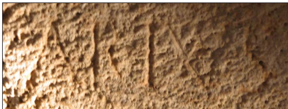
Fig. 9. Detalle del antropónimo.