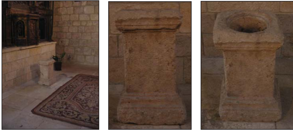
Figs. 1-3. Localización y primer plano del altar.

El monumento en cuestión es un altar de caliza dividido en tres cuerpos, con la cabecera y basa molduradas, presentando un enorme focus en su parte superior. El tamaño total es de 69 cm. (13/38/18) x 39,5/30,5/42 cm. x 33,5/24/37 cm. El campo epigráfico está muy erosionado y se extiende por todo el cuerpo del altar (38 x 30,5 cm.). Las letras son capitales cuadradas, con una altura que oscila entre los 3-2,5 cm.