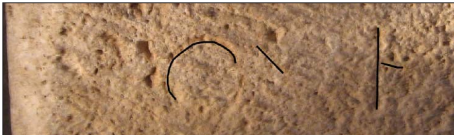
Fig. 11. Caracteres conservados en el inicio de la cuarta línea.

Los testimonios epigráficos de la Legio VI Victrix en las provincias hispanas ascienden a veintidós epígrafes, a través de los cuales se han identificado un legado 13 , seis tribunos militares 14 , cuatro soldados 15 y cuatro veteranos 16 , además de un escueto grupo de inscripciones que atestiguan su labor constructiva 17 . Sin embargo, hasta el momento no se conocía a algún eques . De todas formas, la presencia de equites en las legiones era habitual, aunque no es frecuente encontrar menciones epigráficas de ellos. Así, en las tres provincias hispanas se conserva, por el momento, el testimonio de un eques de la Legio VII Gemina 18 . Además, en otras partes del imperio se han encontrado testimonios de este cargo adscritos a algunas de las legiones que estuvieron en la península, con excepción de la VI Victrix 19 .