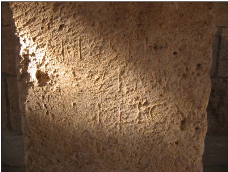
Fig. 4. Texto de la inscripción.