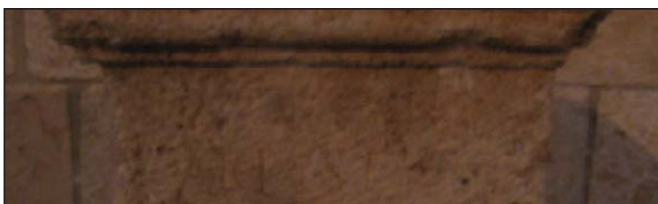
Fig. 5. Detalle de la parte superior del campo epigráfico.