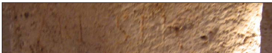
Fig. 8. Segunda línea del texto.

La segunda línea del texto presenta menos problemas. Primero aparece el antropónimo AREVS . A pesar de su singularidad, no es posible apreciar la forma más común ARENVS con nexo EN 9 o bien AREÏVS con nexo EI 10 (Figs. 4, 8-9). Un ejemplo de este antropónimo, en femenino, se puede encontrar en Madridanos (Zamora). Por su parte, en masculino se puede encontrar en Lambasesis (Numidia) 11 . Su declinación en Nominativo invita a identificarlo como el promotor de la inscripción. Tras el nombre se aprecian los restos de dos letras, de las cuales sólo es posible identificar la primera: E . De la segunda tan sólo se conserva un travesaño vertical, que puede corresponder a una I, L, F, R ó, menos probable, E . En todo caso, es probable que se trate del inicio de un patronímico, puesto que Areus es un cognomen .