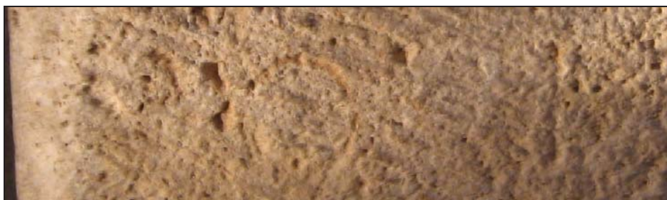
Fig. 10. Restos del inicio de la cuarta línea.

Lógicamente, delante del nombre de la unidad militar debió señalarse el cargo que desempeñó Areus en ella. Por desgracia, precisamente esta zona ha sufrido una enorme erosión conservándose unos pocos trazos sueltos. Éstos corresponden a dos letras que pueden ser O, C ó Q y E, H ó F y que formaron parte de un sustantivo que debió estar compuesto por un máximo de 4-5 caracteres. Además, entre ambas quizá pueda existir un último trazo diagonal, perteneciente a una tercera letra, V , si bien este último punto no es seguro (Figs. 10-11). La unión de todos estos elementos permite inferir con cierta seguridad que el cargo mencionado sería el de [e que(s)] . Con respecto a éste, si bien sorprende la ausencia de la S final en su grafía, conviene señalar que este es un fenómeno sobradamente conocido en la epigrafía de la parte occidental del Imperio 12 .