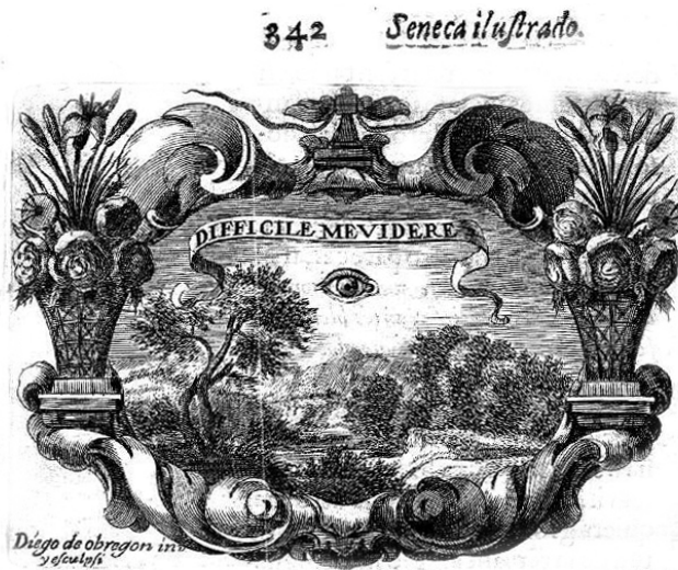
Fig. 3 Difficile me videre . Baños de Velasco. 1670.

“Pudo la atención ser registro de obras ajenas, más en llegando a remirarse en las propias flaqueó el deseo y pasó a emplearse en otras superfluidades extrañas. De poco sirve la especulación adelantada, si se pierde el conocimiento en lo que está más presente, y aquello que pide mayor cuidado se pone a cuenta del olvido, por ocuparse el discurso en lo que no puede servir de conveniencia. Mira el ojo a los demás y no puede verse como es él. Bien sabe toda la Filosofía, que lo más difícil del hombre es conocerse a sí propio, y siendo atalaya de los demás, repare en lo que mismo flaquea. Blasón presente es la capa de los vicios quien cubre el rostro a la razón para que no se mire en sí mismo el sujeto lo que tiene de malo y por donde ha de solicitar el desvío de la culpa, quede la ceguedad más declarada, faltándole conocimiento en lo que obra para enmendarse” 28 .