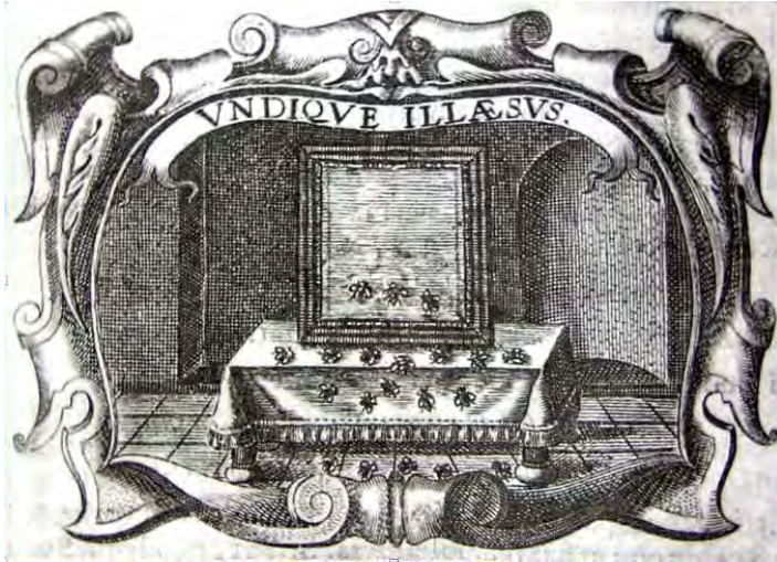
Fig. 2. Siempre Ileso . Juan de Solórzano. 1658.