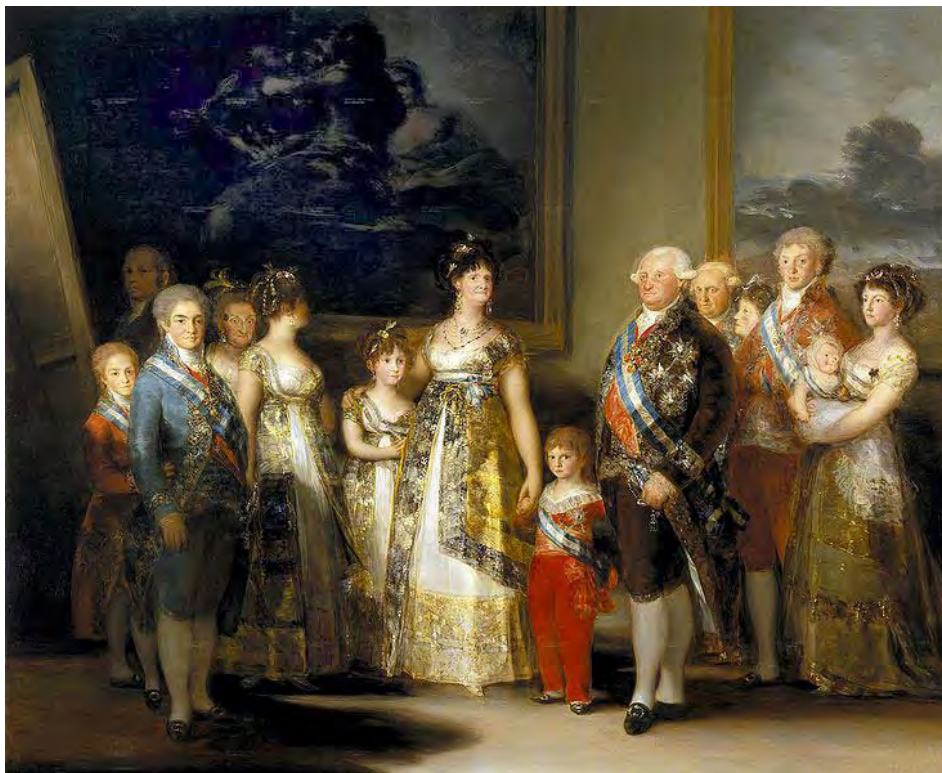
Fig. 1. Retrato de la familia de Carlos IV . Goya.1800. Museo Nacional del Prado. Madrid.

positiva, como confirmación de la permanencia de la tradición monárquica española frente a una crisis efímera” 6 .