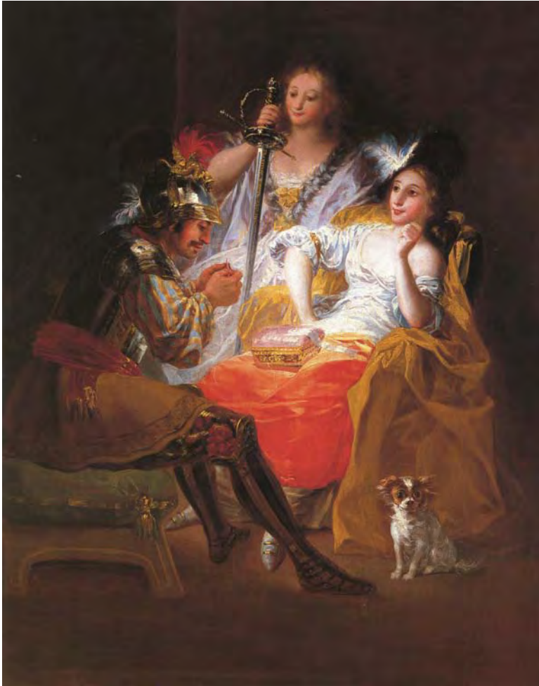
Fig. 4. Hércules y Onfale . Goya. 1784. Colección particular.

obviamente sus “hierros”, esto es sus “yerros” 48 -agravados por travestirse con una saya, so capa de militar-, en vez de ir desnudo y portando la piel del león de Nemea, que es la indumentaria que verdaderamente denota la virtud heroica 49 . Desde luego,