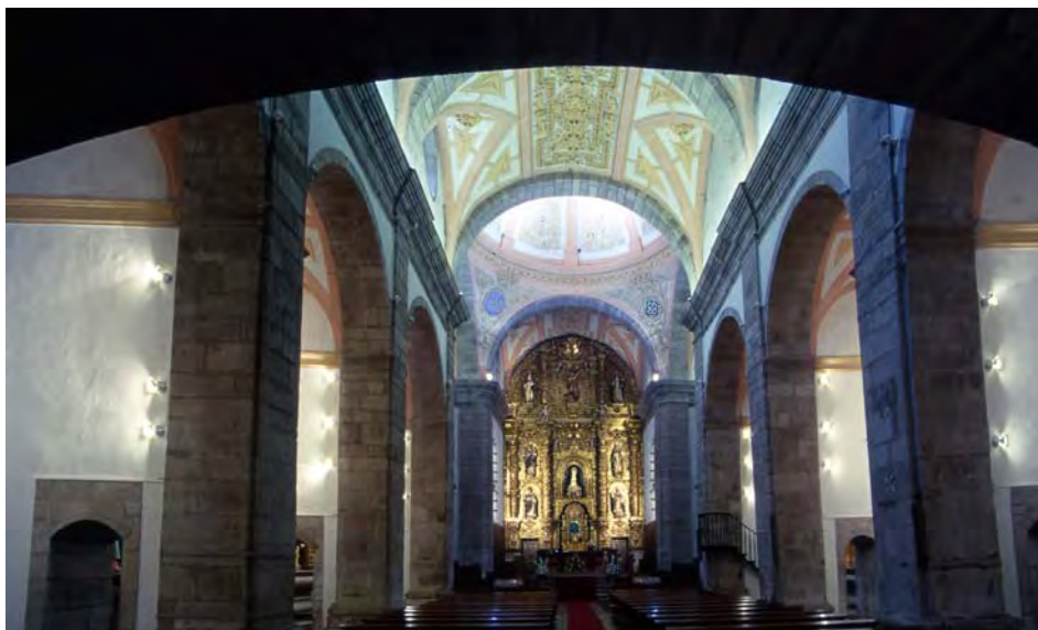
Fig. 3. Convento de Nuestra Señora. Interior de la iglesia. Las Caldas de Besaya.

Cura 24 , que no aporta novedades reseñables a la historia ya conocida. No ocurre lo mismo con la obra editada en 2006 por el padre Alberto González Fuente 25 , en la que se incluyen noticias inéditas que complementan lo conocido hasta hoy tanto del conjunto conventual como de las obras muebles que acoge.