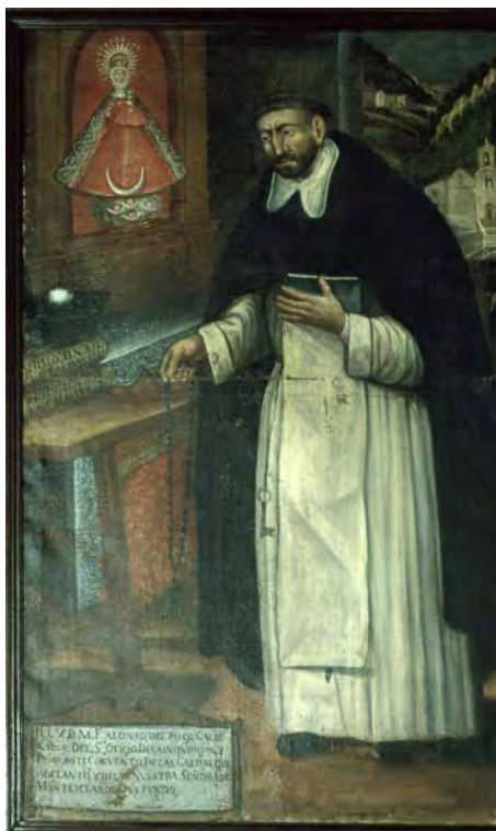
Fig. 1. Retrato del Padre Fray Alonso del Pozo.

Anónimo. Finales del siglo XVII. Convento de Nuestra Señora. Las Caldas de Besaya