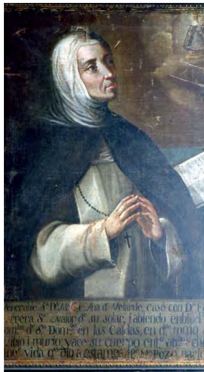
Fig. 2. Retrato de doña María Ana de Velarde.

Anónimo. Finales del siglo XVII. Convento de Nuestra Señora. Las Caldas de Besaya