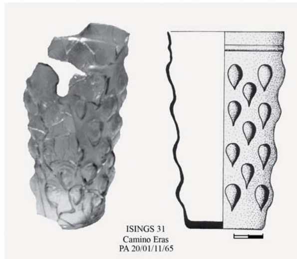
Fig. 1. Herrera de Pisuerga y sus recintos militares. ISINGS 31 (Pérez e Illarregui, 2006: 129, fig. 18)