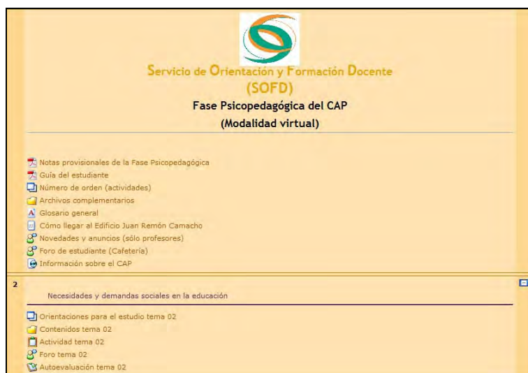
Imagen 1. Plataforma Moodle como recurso estratégico de enseñanza

Analicemos más detenidamente el proceso de reflexión instigado desde los foros, porque ha sido la herramienta más productiva, a nuestro modo de ver, en relación con la “educación para la ciudadanía”.