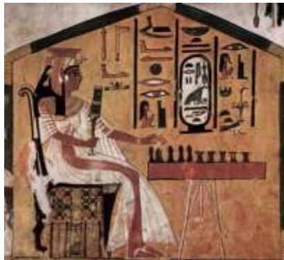
Pintura en la pared

Las imágenes se podían encontrar en las paredes de las tumbas y en los papiros, las representaciones tenían que ver mucho con la vida cotidiana o el Más Allá. Enfocaban la importancia de los personajes representados por el tamaño, por el ejemplo, el faraón siempre era más grande que el resto de personajes que le rodeaban.