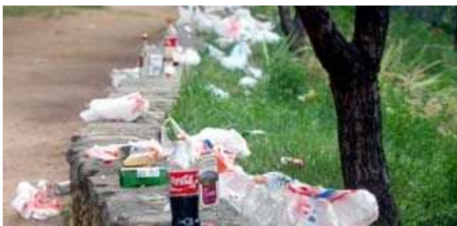
Foto de la noticia: Restos de un “botellón”, en la zona de la Hontanilla, un paisaje habitual los fines de semana.

Al menos tres jóvenes han sido detenidos y puestos a disposición judicial tras haber participado en una pelea ocurrida la noche del sábado en el paraje conocido como la Hontanilla, en la capital, donde cada fin de semana se concentran cientos de chavales en torno al popular botellón.