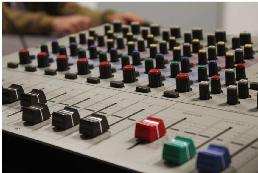
Imagen 4: Consola de Radio utilizada para la grabación del Programa Generaciones en Sintonía

Esto fue un hecho importante, ya que fue la primera vez en Emisión Mahonita que se grabó un programa con las músicas incluidas, sin tener la necesidad de juntar a los técnicos y ponerlos a trabajar en la post-producción del envío, después de haberlos hecho trabajar en la grabación del programa.