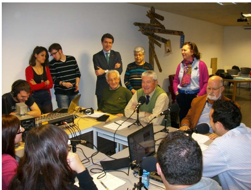
Imagen 6: Fotografía publicada en el periódico “El Adelantado” de Segovia. A raíz de la noticia reflejada tras el primer programa.

Si hablamos un poco de lo que fue la repercusión que hubo en los medios de Segovia en relación al programa, nos gustaría aclarar, que en primer lugar, fue al inicio de la emisión cuando la noticia de la continuación de este proyecto tuvo más notoriedad en los periódicos locales. Fue “El Adelantado de Segovia”, quién publicó una noticia, en un tamaño considerable, en la cual narraba la experiencia radial y nombraba a todos los participantes. Esta noticia, tuvo lugar el día domingo 14 de Abril (los domingos es el día de mayor tirada del periódico) en la sección “Sociedad”. La información tuvo a un costado la siguiente imagen: