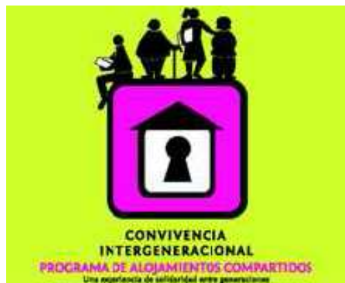
Imagen 2: La portada del “Programa de Alojamientos Compartidos”

Otro de los puntos que nos sirvieron para entender el conflicto a analizar, fue el de ver la participación de las personas de ambas generaciones en el programa de Alojamientos Compartidos. 10