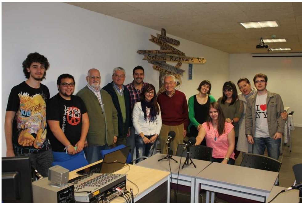
Imagen 5: El plantel completo de la tercera temporada de Generaciones en Sintonía