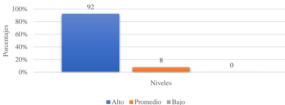
Figura 5. Frecuencia de los niveles de compromiso organizacional en vendedores de una empresa retail-Chiclayo, agosto-diciembre 2017.

En los niveles de compromiso organizacional, se evidencia que 92% de colaboradores presentan un nivel alto, y un 8% promedio. (Ver figura 5)