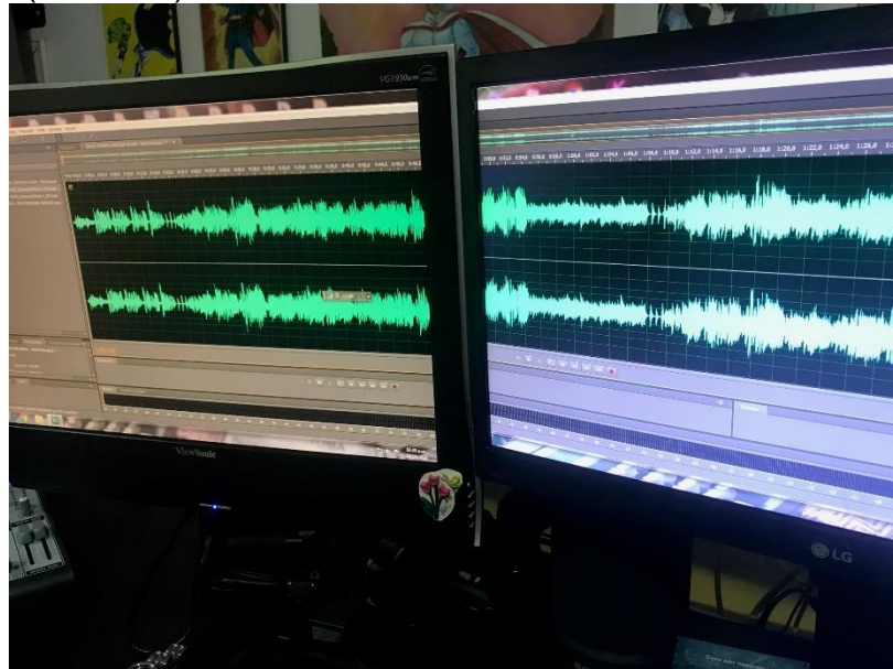
Imagen 12. Foto donde se evidencia el momento de la mezcla. (15/09/2018). (Anexo G).

En la imagen anterior se observa el momento en donde se realizó la edición y mezcla de las obras.