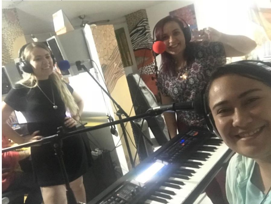
Imagen 11. Foto de “Fascino Trio” en el momento de la grabación. Fuente Propia. (15/09/2019). (Anexo G).

En la anterior imagen se ve a la agrupación “Fascino Trío” en el momento de grabación.