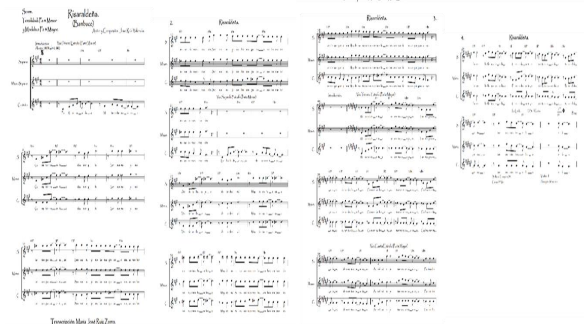
Imagen 9. Miniatura de la obra “Risaraldeña” escrita para formato trío vocal. Páginas de 1-4. (Anexo F).

En la imagen anterior se ve el arreglo realizado de la canción “Risaraldeña” escrito a tres voces.