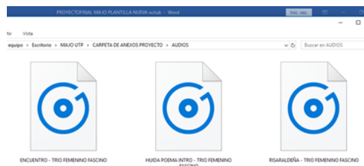
Imagen 13. Captura de pantalla del registro sonoro de las obras “Encuentro”, “Huida” y “Risaraldeña”. (Anexo G).