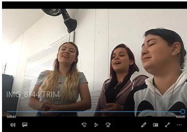
Imagen 11. Muestra de un ensayo donde se realiza el ensamble de una de las obras. Captura de pantalla del video de la agrupación “Fascino Trío” en ensayo de la obra “Risaraldeña”. (02/08/2018). (Anexo G).

En la anterior captura de pantalla, se observa el ensamble de la canción “Risaraldeña” por parte de la agrupación “Fascino Trío”