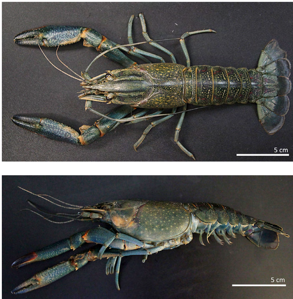
Figura 1. Vista dorsal (imagen superior) y lateral (imagen inferior) de una hembra de C. quadricarinatus de la laguna de Labradores, Galeana, Nuevo León.

Muchos países de Asia, África, Europa, Medio Oriente, Norte, Centro y Sur de América, incluyendo Australia, han importado y cultivado varias especies de Cherax con éxitos y fracasos (Ahyong y Yeo, 2007; Jaklic y Vrezec, 2011; Lawrence y Jones, 2002; Mendoza-Alfaro et al., 2011; Snovsky y Galil, 2011). Esta actividad ha provocado en algunos casos el escape de especímenes de granjas o centros de producción y su posterior establecimiento en ambientes silvestres de Bahamas, Colombia, Ecuador, Jamaica, México, Paraguay, Argentina, Puerto Rico, Filipinas, Singapur, Israel, Sudáfrica, Israel, Eslovenia y