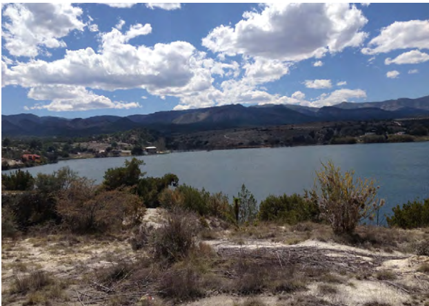
Figura 2. Vista panorámica de la laguna de Labradores, Galeana, Nuevo León (septiembre 2016).