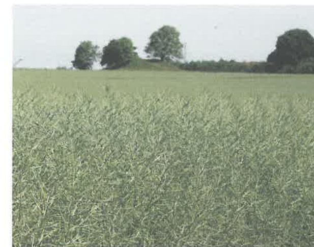
Vellykket økologisk vinterraps.

Det er spændende om de økologiske landmænd i løbet af nogle år kan bestille snyltehvepse, der klarer problemerne omkring skadedyr. ●