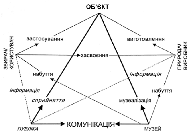
Рис. 4. Пентаграма зв'язків об'єкта (за Ф. Вайдахером)

На нашу думку, місце музеології (музеєзнавства) в системі наук є дискусійною проблемою. Зокрема, Р. В. Маньковська, аналізуючи це питання, зазначає, що у Загребі (Хорватія) музеологію відносять до інформаційних наук, в Чехії – до історичних, в Росії – спочатку до історичних, потім культурологічних (як і в Україні), а сама дослідниця вважає, що музеологія формується на стику соціального і гуманітарного пізнання [5, с. 137–138]. Цієї точки зору дотримуються й деякі інші науковці [напр.: 3, с. 67]. Ф. Вайдахер же наголошує, що за своїм підходом до оцінки