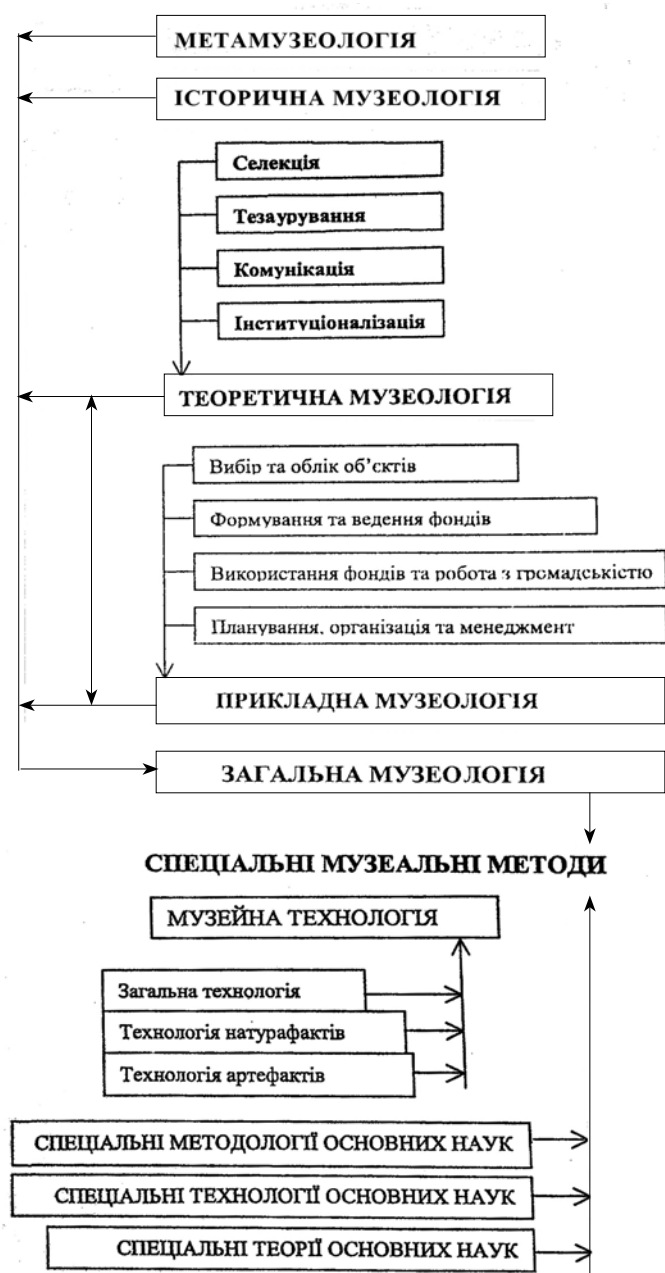
Рис. 2. Система музеології (за Ф. Вайдахером)

дійсності (музейної потреби), феномен музейного предмета, займається вирішенням проблеми щодо суспільних функцій музею, їхнього місця у системі інших інститутів, технології та класифікації музеїв, формування та функціонування музейної мережі тощо [6, с. 25–26]. Тобто, значне коло питань, яке розглядала загальна теорія музеєзнавства, Ф. Вайдахер відносить до метамузеології. Водночас до теоретичної музеології він відносить такі теорії, як селекція (музейна ідентифікація та відбір об'єктів), тезаурування (створення та забезпечення функціонування музейних колекцій), комунікація (використання