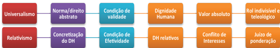
Figura 1 - Universalismo de Efetividade Ponderada ou Relativa

virtude de qualquer que seja a unidade de argumentação que destoe do valor fundamental e supremo humano: a dignidade. O relativismo, por outro lado, é condição de máxima efetividade ou concretização ao direito, considerando-se que os direitos humanos são relativos quando em rota de conflito com outros de sua categoria, caso em que haverá, como explanado, a necessidade de exercício de um juízo de ponderação como método procedimental de solução de conflitos ou mesmo de adequação à realidade peculiar, que importará na limitação de um em face do outro direito. Segue-se uma quadro ilustrativo e representativo da proposição.