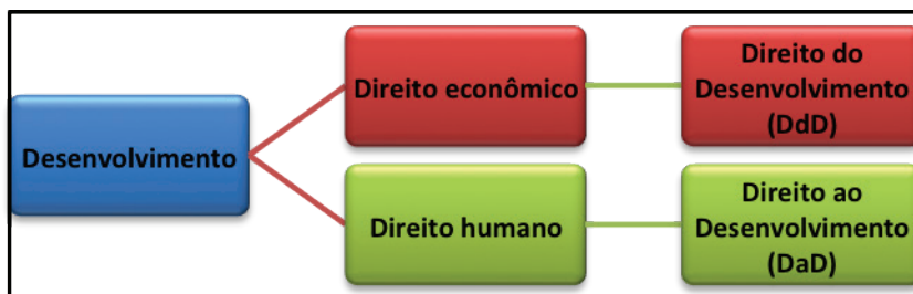
Figura 1 – Relação Desenvolvimento x DdD e DaD

Ambos possuem raiz comum no desenvolvimento, mas diferem pela área em que se inserem e pela amplitude que alcançam. O DdD refere-se ao direito econômico constitucional, manejado no âmbito das interações entre Estado e agentes de mercado (FEITOSA, 2013, pp.173-174), porém com objetivo de atendimento ao interesse social no tocante aos DESC, através de processos e estratégias econômicas que lidem com fenômenos socioeconômicos de caráter promocional (prestação positiva do Estado 6 ) referidos, por exemplo, nos artigos 6º (Direitos Sociais) e 170 (Ordem Econômica), da Constituição Federal do Brasil de 1988 (SARLET, 2006, p. 293). Significa que o DdD pode ser encontrado e positivado em leis e codificações formais.