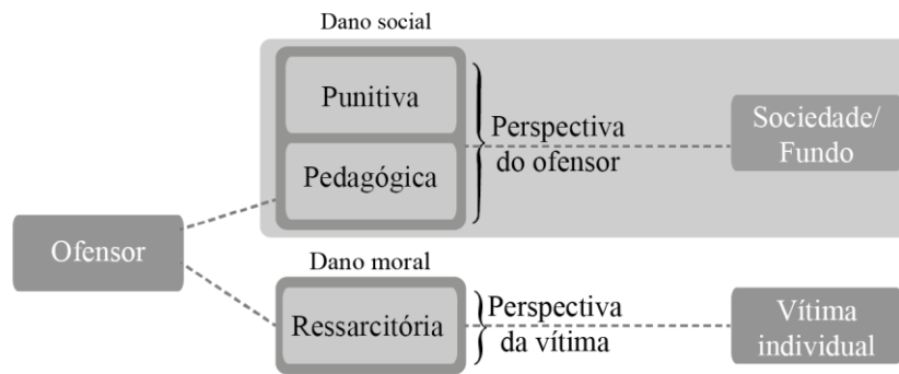
FIGURA 2: A divisão da finalidade dos danos como proposta pelo trabalho