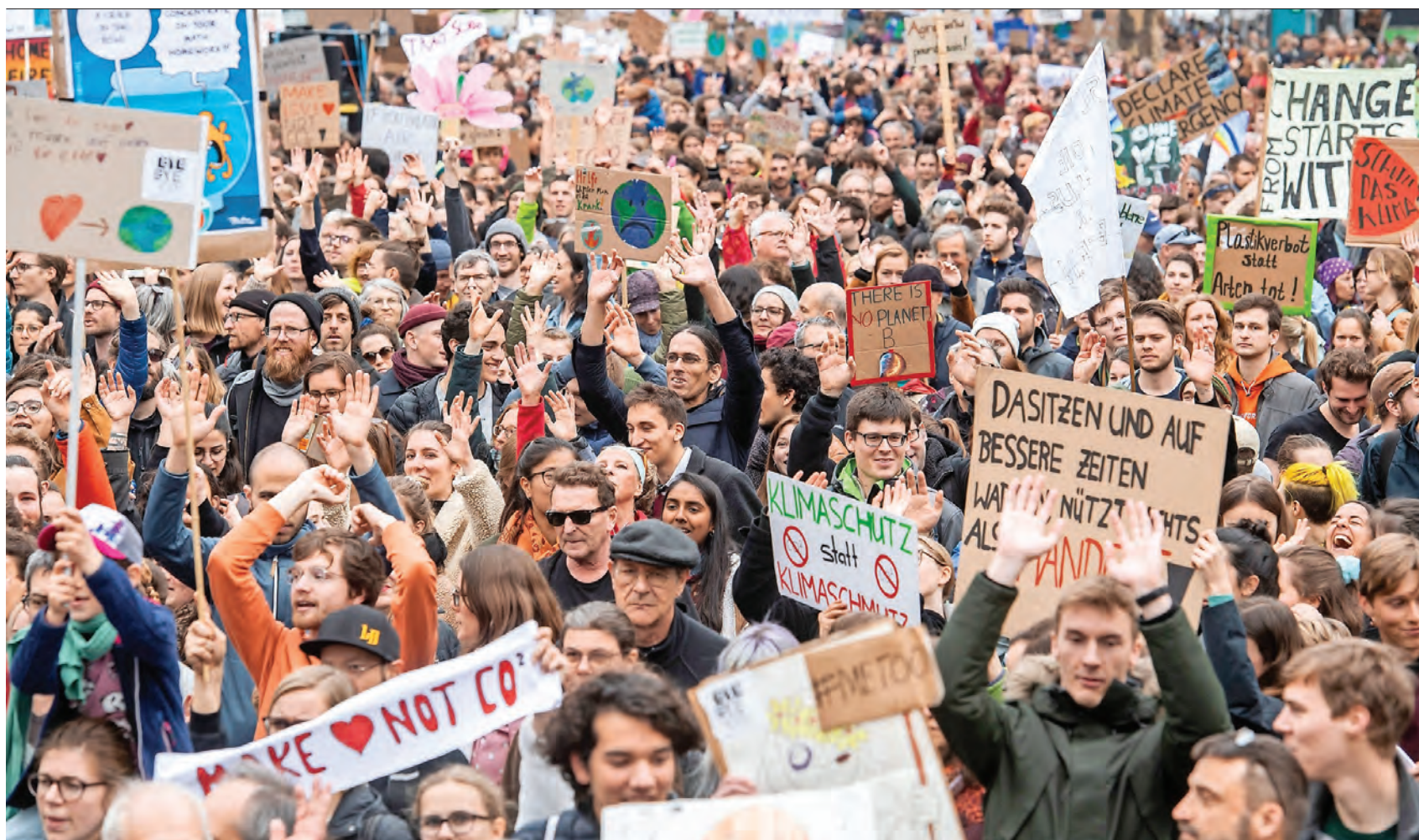
Klimademo in Zürich am 6. April: Es geht nicht um eine «übertriebene Forderung von übermütigen Jungen», sondern um Logik und Konsequenz.