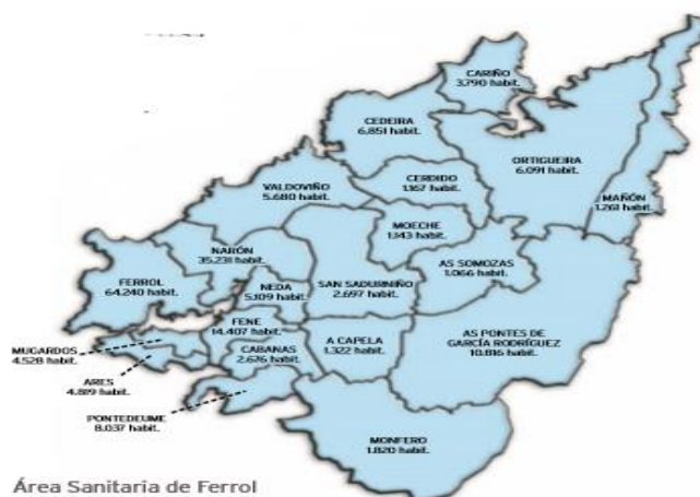
Figura 3: Área sanitaria de Ferrol

Se llevará a cabo en el área sanitaria de Ferrol, incluyendo los centros de atención primaria de la comarca, y el CHUF.(45) .(Figura 7)(Tabla V)