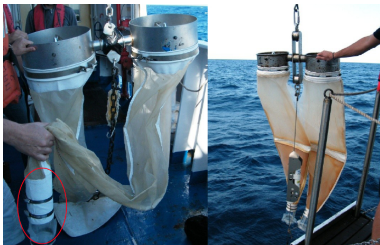
Figura 1: L'immagine a sinistra mostra il bongo 40, evidenziato, dal cerchio rosso, il cilindro in plexiglass chiamato "bicchiere". A destra l'immagine della Calvet.

La struttura così composta viene trainata alla dritta della nave ad una velocità di 2 nodi. La velocità di discesa dello strumento è di circa 0,75 m/s, mentre la risalita avviene a circa 0,33 m/s. Il cavo in acciaio che sostiene tutta la struttura deve mantenere sempre un angolo ideale con la superficie del mare di circa 45°. Tale angolo viene misurato ad ogni 20 m di cavo rilasciato con l'utilizzo di un goniometro a vista. Al termine della discesa il bongo rimane fermo 30" in stabilizzazione che servono allo strumento per mettersi nella giusta posizione e alla giusta profondità. Recuperato lo strumento viene verificata la profondità reale raggiunta dal Bongo per mezzo di un profondimetro digitale montato su di esso. Durante tutto il processo viene riempito un modulo cartaceo con i valori delle varie fasi di acquisizione dell'operazioni al fine di essere rielaborate successivamente (fig. 2). La Calvet (fig. 1) ha una struttura molto simile al bongo con la differenza che le bocche sono più piccole (diametro 25 cm; maglia 150 µm) e che il campionamento avviene in verticale lungo la colonna d'acqua a nave ferma. La Calvet viene utilizzata per campionare le uova di acciuga e di altre specie pelagiche nella colonna d'acqua, da 100 m di profondità fino ad arrivare in superficie, con velocità di discesa e di risalita di 1 m/s.