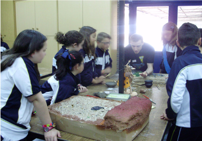
Fig. 1. Actividad “Megalitismo: la excavación arqueológica”. Adaptada al nivel 6º de Primaria. Colegio San Gabriel, (Alcalá de Henares). Grupo DIPHA 2014.

El carácter procedimental de la enseñanza de la Arqueología proporciona una participación directa del alumnado en la reconstrucción e interpretación del pasado “rompiendo las barreras existentes entre el libro de texto y la simple recepción de conocimientos cerrados e inamovibles”. 16