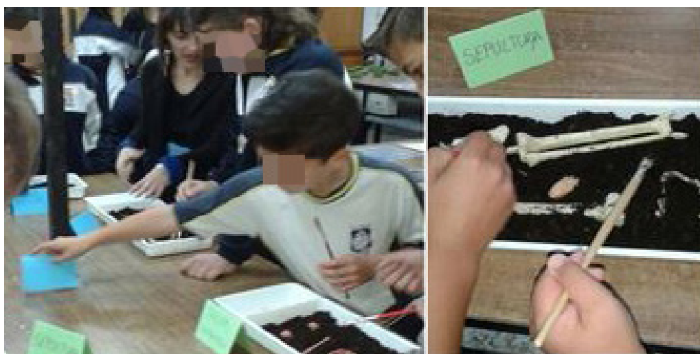
Fig. 2. Actividad “Megalitismo: la excavación arqueológica”. Adaptada al nivel 6º de Primaria. Colegio San Gabriel, (Alcalá de Henares). Fotografía realizada por el Colegio San Gabriel. 2015.

La interacción alumno-materiales arqueológicos es llevada a cabo a través de diferentes recursos visuales adaptados a los variados niveles educativos a los que podemos enfrentarnos. Los adolescentes muestran más interés por las nuevas tecnologías, por lo que los recursos visuales en formato digital son más apropiados para ellos que para los niños de menor edad, quienes prefieren objetos directos, es decir, que estén físicamente en la sala materializados en maquetas, réplicas e, incluso, en piezas originales procedentes de la Universidad de Alcalá.