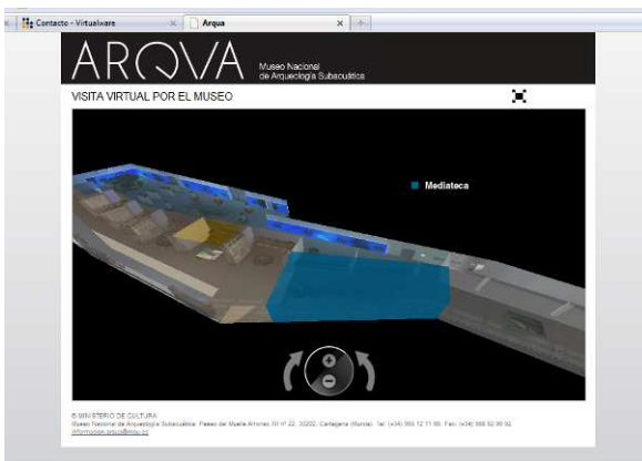
Figura 1. Visita cenital del espacio expositivo

Cuando lo desee, de manera intuitiva, el internauta pasea con total libertad por el perímetro de los exteriores del museo a pie de calle, para así entrar en el interior del mismo y descubrirlo.