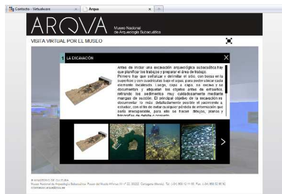
Figura 3. Contenidos multimedia

El 2 de marzo se presentaba el proyecto V-Must en Roma una Red de Excelencia de la UE financiada por el 7º Programa Marco cuyo principal objetivo es apoyar al sector museístico a innovar en la utilización de las nuevas tecnologías y la realidad virtual para generar experiencias de valor añadido para el visitante.