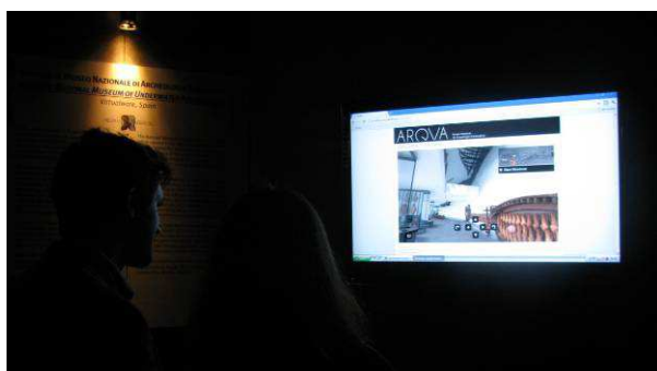
Figura 4. Primer encuentro V-MUST en el que se presenta Arqua Interactivo (Congreso Arqueovirtual, Salerno 2010)