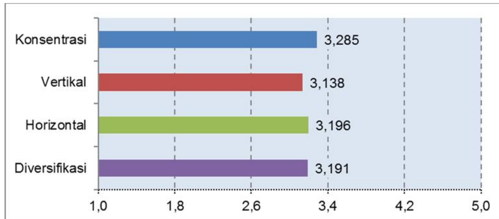
Gambar 1 Grafik Capaian Skor Rata-Rata

Dilihat dari rentang skor idealnya, capaian skor rata-rata untuk setiap dimensi pada variabel ini dapat disajikan pada gambar berikut.