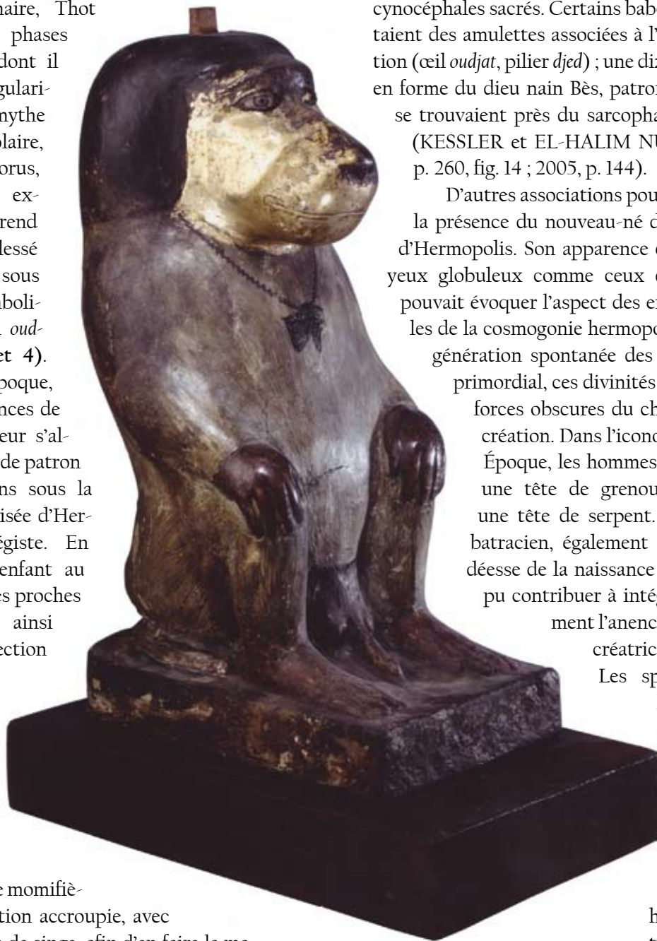
fig. 3 : Statue en bois du dieu Thot (H. 39 cm), ép. romaine (I er -IV ème siècles après J.-C.). D'Akhmim, Londres, British Museum, EA 20869

Les prêtres le momifièrent en position accroupie, avec une amulette de singe, afin d'en faire la manifestation du pouvoir divin de Thot, à l'image des