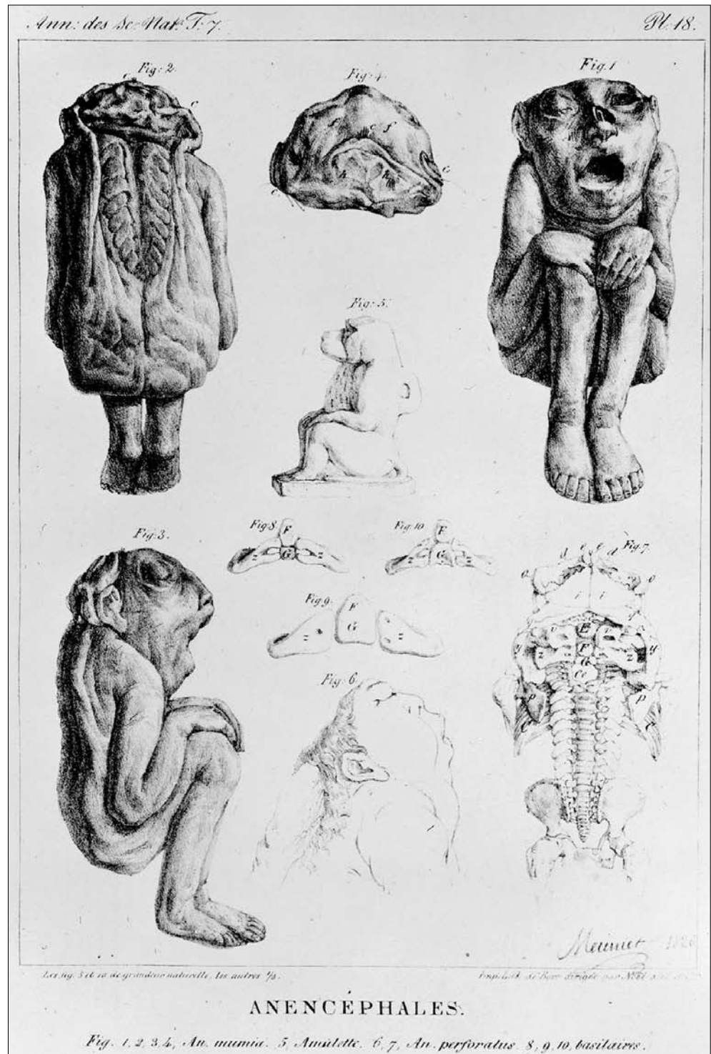
fig. 2 : L'anencéphale momifié d'après E. Geoffroy Saint-Hilaire, Description d'un monstre humain né avant l'ère chrétienne et considérations sur le caractère des monstres dits Anencéphales, Annales des Sciences Naturelles, 6, 1826, pl. 18

L'anencéphale ne fut pas nécessairement interprété comme le fruit d'une union bestiale. Son apparence vaguement simiesque, mais surtout le développement inachevé de son corps, peuvent expliquer le choix de la protection du dieu Thot, associé au concept de croissance et de complétude.