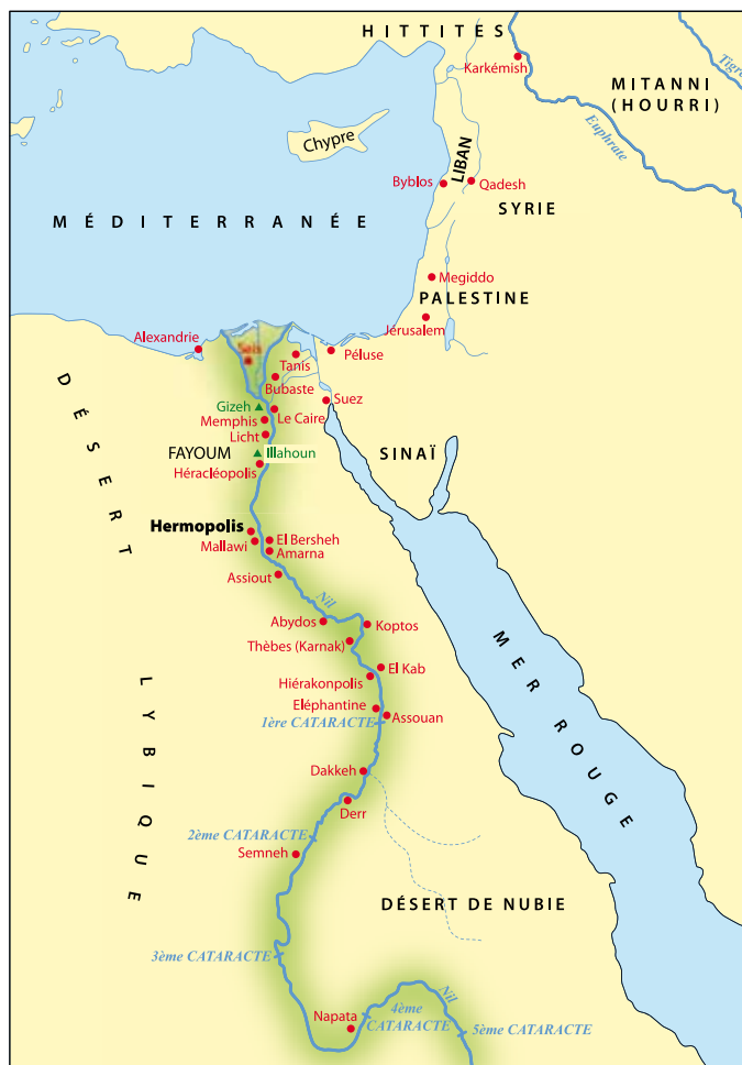
fig. 1 : Carte d'Égypte, d'après I. Woldering, Égypte. L'art des Pharaons , Paris, 1963, pl. I

En 1825, l'archéologue et aventurier Joseph Passalacqua rapporta en France de nombreuses antiquités pour en faire commerce, dont une série d'animaux embaumés qu'il présenta à l'anatomiste Étienne Geoffroy Saint-Hilaire pour les identifier. L'aspect de l'une d'elles attira l'attention : il ne s'agissait pas d'un singe mais d'un enfant mort-né, sans voûte crânienne, le bas de la région cervicale largement ouvert. Pour le savant, qui travaillait à l'élaboration d'une classification des monstruosité humaines ( PHILOSOPHIE ANATOMIQUE , 1822), la momie entra dans la catégorie des anencéphales,