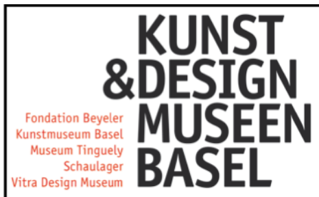
Abbildung 2: Logo Kunst & Design Museen Basel