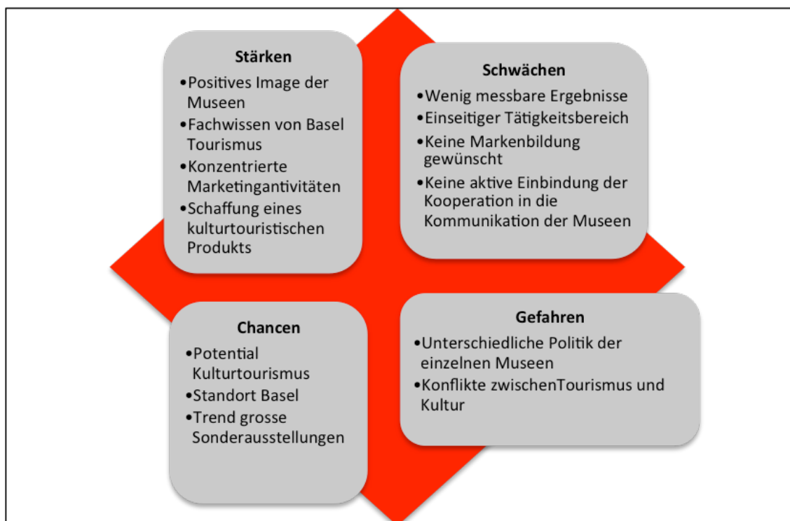
Abbildung 5: SWOT-Analyse

In der SWOT-Analyse (Strength, Weaknesses, Opportunities, Threats) werden die Stärken und Schwächen, Chancen und Gefahren einer Unternehmung ermittelt. Die Stärken und Schwächen werden aus dem Innern der Unternehmung ermittelt und die Chancen und Gefahren decken externe Einflüsse auf. Die Analyse soll primär die relevanten Punkte aufzeigen, die einen direkten Einfluss auf die Unternehmung haben (Kotler, 2011, S. 172-173).