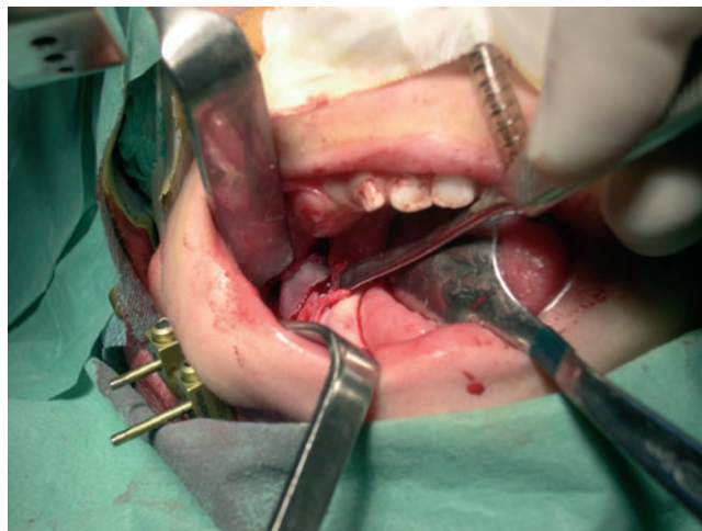
Figura 2 - Corticotomía en área retromolar. Inserción del distractor externo.

Todo ello se realiza de forma bilateral, y por último se insertan de forma percutánea 2 clavos a cada lado de corticotomía. Estos son siempre bicorticales, y mediante palpación digital debe controlarse la cara lingual de la mandíbula. Deben quedar muy estables para evitar una complicación relativamente frecuente, como es la pérdida de los clavos