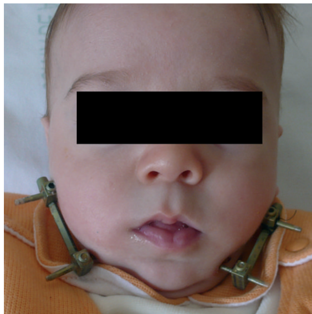
Figura 4 – Secuencia de Pierre Robin en período de distracción ósea.

Se trató a 4 pacientes entre los 3,5 y los 16 meses: dos con secuencia de Pierre Robin, uno con síndrome de Threacher-Collins y otro con síndrome de Cornelia de Lange. Se realizó distracción mandibular osteogénica unidireccional, con distractores externos de Molina. No hubo que someter a ninguno de los 4 pacientes a traqueostomía durante sus episodios de