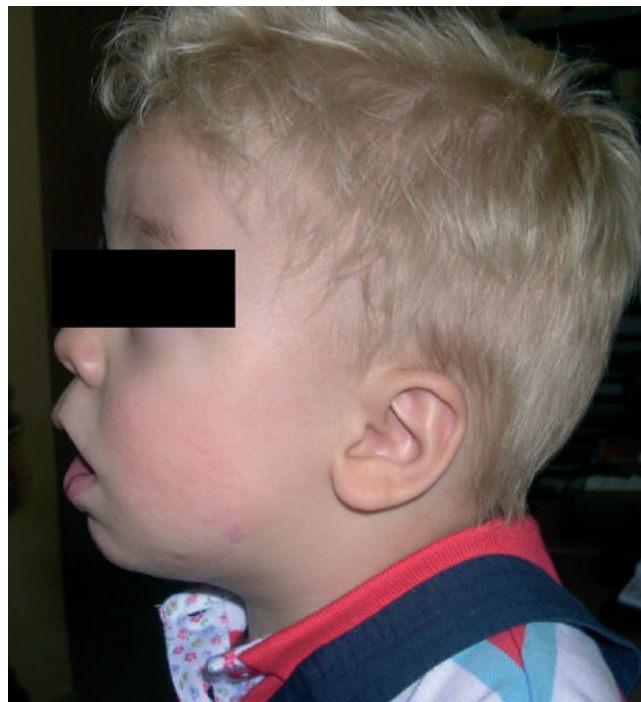
Figura 7 – Niño de la figura 4 a los 18 meses posdistracción.

Esta técnica es una buena alternativa a la traqueostomía en pacientes neonatos con problemas de apnea obstructiva grave. Las indicaciones para realizar la distracción mandibular se van ampliando al mejorarse la técnica, por lo que se