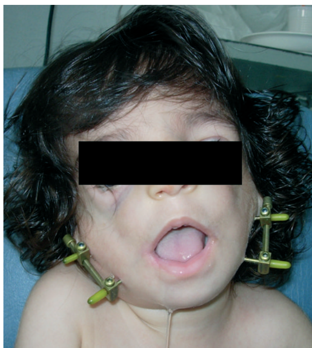
Figura 5 – Síndrome de Treacher-Collins. Sobrecorrección y mordida abierta anterior.

Todos los pacientes presentaban fisura palatina. En tres de ellos se ha realizado reparación de la fisura palatina con veloplastia intravelar tras distracción osteogénica mandibular, sin ninguna complicación.