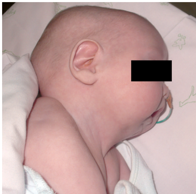
Figura 3 – Secuencia de Pierre Robin. Alimentación con sonda nasogástrica

Recién nacido de 41 semanas de gestación y 3.230 g de peso, que precisó reanimación tras el parto. Presenta secuencia de Pierre Robin y síndrome malformativo, con asimetría torácica e implantación baja de pabellones auriculares (fig. 3). Antecedentes de hermano y tío paterno con secuencia de Pierre Robin. Cariotipo normal. Desde el nacimiento experimenta episodios de apnea obstructiva que se resolvieron con medidas posturales. Mejoría transitoria hasta que fue dado de alta, ya que los padres inicialmente no aceptaron tratamiento con distracción mandibular por tener experiencia con el hijo anterior que mejoró y no necesitó otro tratamiento que el postural. Tras el alta, el paciente presentó dos episodios de insuficiencia respiratoria grave y en uno de ellos precisó reanimación cardiopulmonar e intubación. Desde entonces presentó episodios frecuentes de apnea obstructiva alta que mejoraron con medidas posturales. Se realizó distracción mandibular a los 4 meses de edad. Tras la distracción con