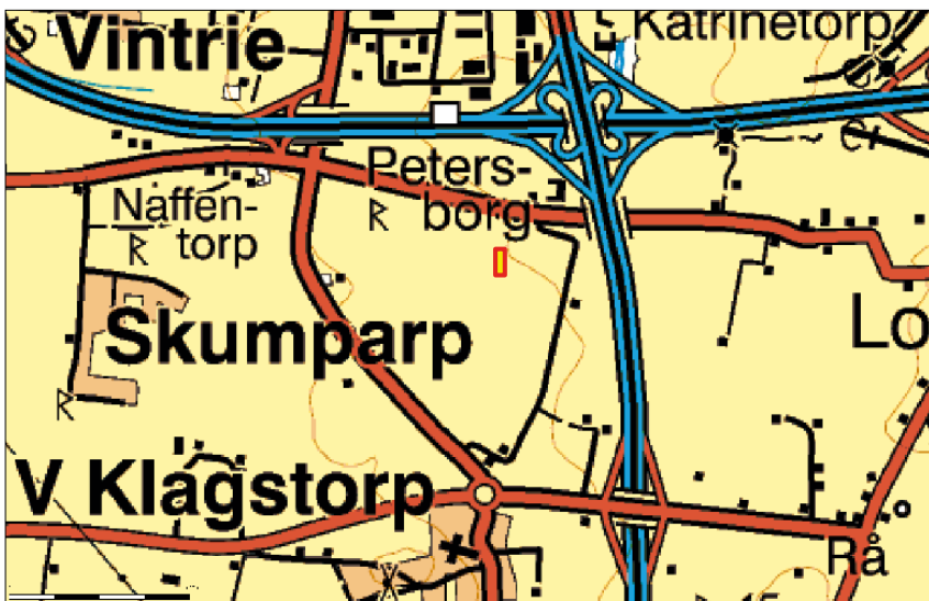
Figur 1-2 Försöksfälten är inritade med en rödgul rektangel. Avstånden mellan försöksfältet och motorvägarna är 600 meter (E20, yttre ringleden) respektive 640 meter (E6/E22 mot Trelleborg).

metaller, mikrospårämnen och mullbildande ämnen har årliga provtagningar genomförts på jord och grödor (Andersson, 2009).