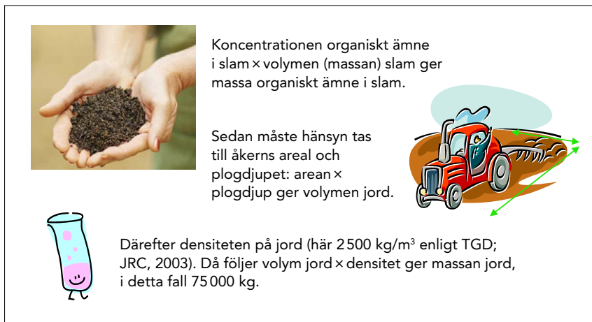
Figur 2-2 Illustrerar och beskriver hur de teoretiska beräkningarna för att uppskatta koncentrationen av organiska ämnen i jorden efter slamspridning utfördes

De teoretiska beräkningarna gjordes som illustreras och beskrivs i figur 2-2.