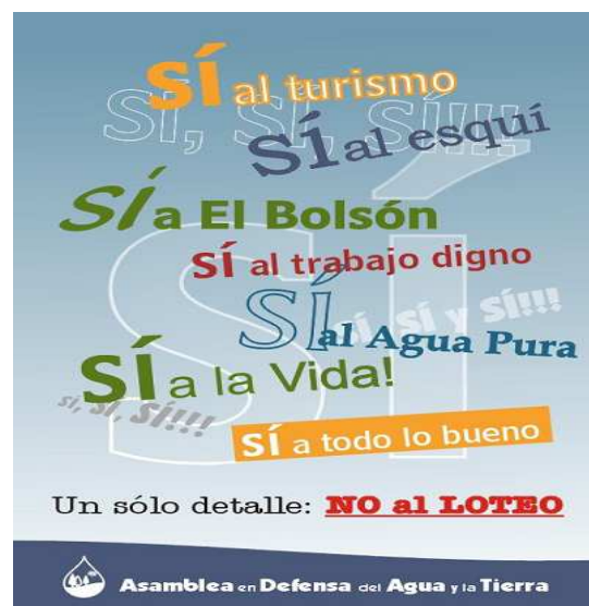
Figura N.º 3: Poster de la Asamblea en Defensa del Agua y la Tierra