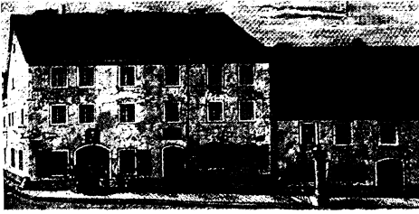
Hahnemanns Geburtshaus in Meißen

in Siebenbürgen konnte er nicht nur viele Fälle von Wechselfieber (Malaria) beobachten und behandeln, sondern erkrankte auch selbst daran. 1779 studierte er noch ein Semester in Erlangen und promovierte dort mit einer Arbeit über die Ursachen und Behandlung von Krampfleiden.