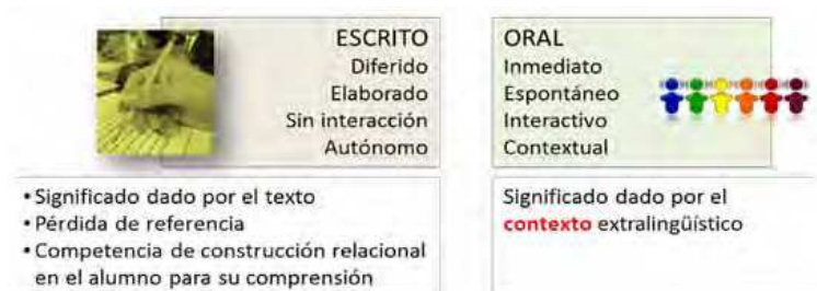
Fig. 1 – Diferencias entre texto instruccional escrito y oral, diferencias

En estos casos, los textos escritos cumplen una función mediadora del aprendizaje y el profesor es quien debe compensar/reponer el contexto perdido en el intercambio cara a cara (no puede solicitar que p. e. se: –construya la recta ahí – sino que debe ser más explícito, de modo verbal o visual apelando a datos complementarios: – [...] construya la recta ab siendo a el punto de intersección entre el segmento pq y [...] –). Para ello debe apelar a la competencia de construcción relacional del alumno para su decodificación. Esto último significa que tiene que anticipar la pérdida de referencia con la inclusión de información adicional que el alumno, por medio de inferencias y puesta en acto de conocimientos previos, reponga para lograr así, autonomía en sus acciones.