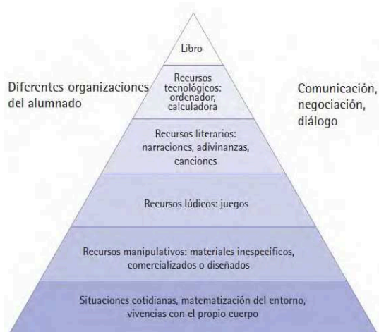
Figura 2: Pirámide de la Educación Matemática (Alsina, 2010), p.14

“tomarse” alternativamente, como las situaciones de aprendizaje mediante recursos literarios con un contenido matemático (cuentos populares, narraciones, novelas, canciones, adivinanzas, etc.) o los recursos tecnológicos. Por último, en la cúspide, se encuentran los contextos de aprendizaje que deberían usarse de forma ocasional, como por ejemplo los libros o cuadernos de actividades.