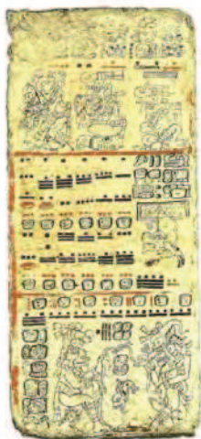
Figura 1. Página 44 del Códice de Dresde

Se considera que lo que se desea representar con la figura de semilla para el concepto de cero, es el sentido del nacimiento de la vida. Se puede leer en el Pop Wuj :