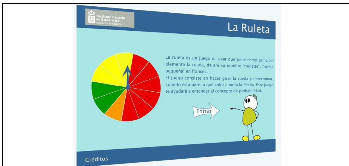
Fig. 4: Aplicación interactiva para la Probabilidad

Por último, siempre es divertido ponernos a prueba y nosotros ponemos a prueba los conocimientos estadísticos de los usuarios a través de los cuestionarios en la sección ¿Qué sabes de...? En esta sección se muestran seis cuestionarios, divididos por tipos de contenidos estadísticos del currículo de Secundaria, tanto obligatoria como no obligatoria, con los que el usuario puede autoevaluar sus conocimientos de conceptos estadísticos. El profesor puede usar estos cuestionarios como actividad de síntesis al finalizar una unidad didáctica trabajada en el aula o, como evaluación de conocimientos previos al iniciar otra en un nivel superior.