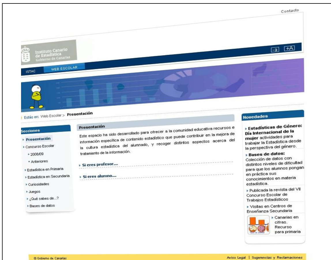
Fig. 1: Pantalla inicial de la Web escolar

Como sitio web dirigido principalmente al uso educativo, la WEB escolar ha de satisfacer las tres funcionalidades básicas de uso de Internet en la educación actual: información, comunicación y soporte didáctico. La función de información tiene dos direcciones: la de ofrecer información estadística y la de contribuir al conocimiento de la realidad canaria a través de los datos. Ésta y el resto de funciones están recogidas en las siete secciones principales que constituyen el menú de navegación: Concurso escolar, Estadística en Primaria, Estadística en Secundaria, Curiosidades, Juegos, ¿Qué sabes de...? y Bases de datos , diseñadas en un entorno más amigable que el exclusivamente institucional, cumpliendo determinadas normas, entre ellas la accesibilidad.