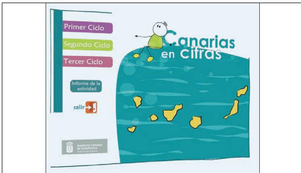
Fig. 3: Aplicación interactiva para Primaria

La nueva imagen de la WEB escolar hace una apuesta importante por la educación estadística desde los más pequeños y la adaptación a los nuevos currículos. El ISTAC ha editado una aplicación educativa interactiva denominada "Canarias en cifras" que pretende llevar al alumno de Primaria, desde el primer al tercer ciclo, a conocer la Comunidad Autónoma de Canarias y las diferentes islas que la conforman, a partir de sus datos estadísticos. "Istaquito", que así se ha denominado la mascota que acompaña en esta aplicación educativa a los niños, les propone a los alumnos actividades estadísticas según el ciclo en el que se encuentren. En el primer ciclo, a través de las formas, el tamaño y el color, llevamos a los alumnos a conocer la colocación geográfica de cada isla dentro del archipiélago canario, ordenarlas de mayor a menor superficie y construir un diagrama de barras basado en la clasificación de colores. En el segundo ciclo el alumno puede construir cartogramas y relacionar la información de cada barra con el concepto que representa y que, en el tercer ciclo, además, relacionará con la cantidad. La actividad se complementa con un informe de las actividades que se han realizado, los intentos que se han hecho y cuantas se han completado satisfactoriamente, con el que el profesor puede controlar el desarrollo del aprendizaje. Ésta y todas las actividades interactivas pueden ejecutarse en web o descargarse según preferencia del docente.