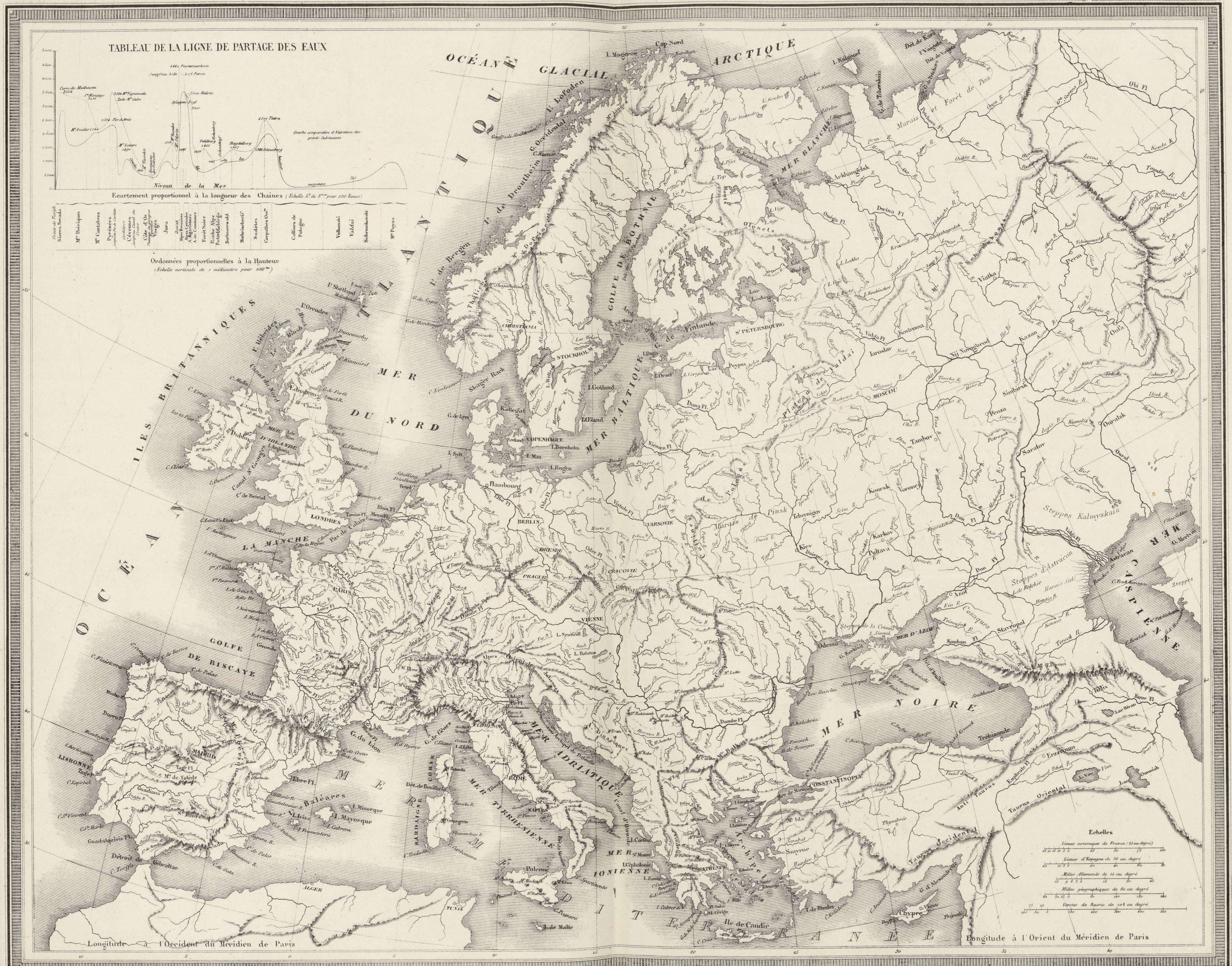
Ordonnées proportionnelles à la Hauteur (Echelle verticale de 1 millimètre pour 100 ms )