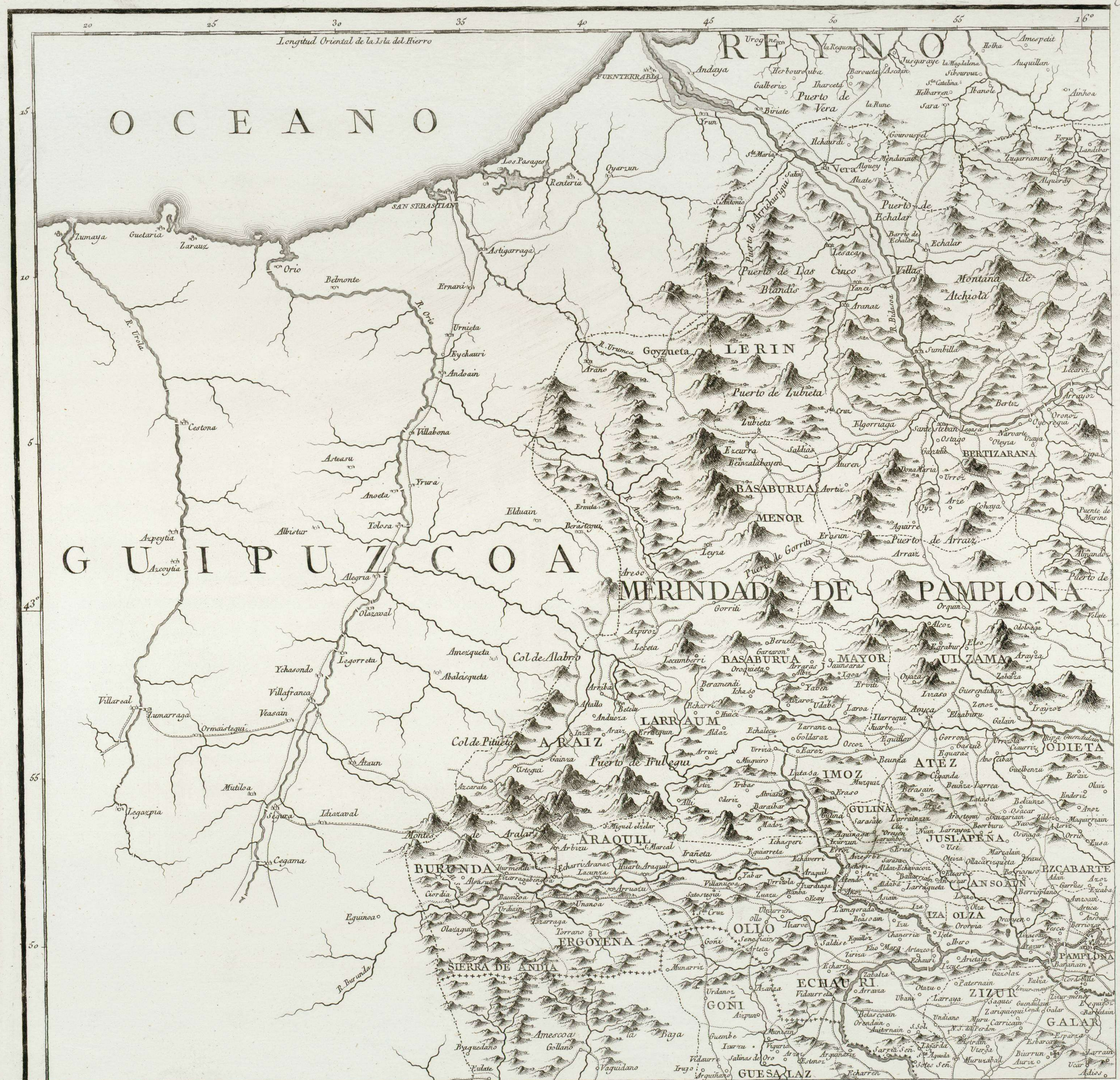
Parte tercera de Navarra