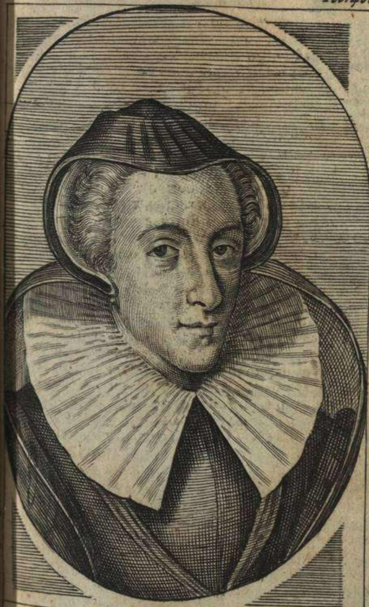
MARIA STVART, D. G. Scotiae Regina et Douag. Gallicae.