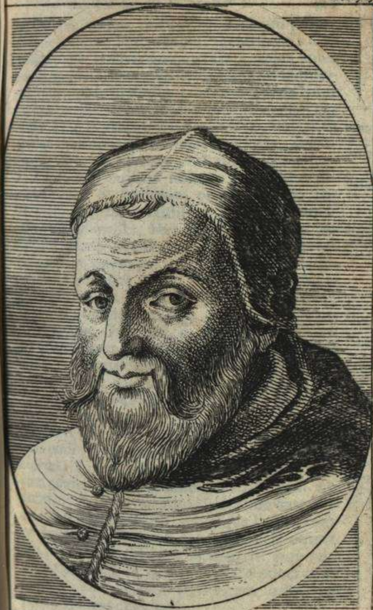
SIXTVS V. PONTIFEX MAXIMVS.