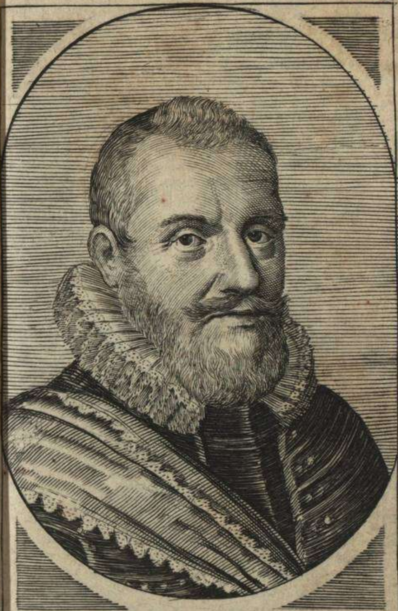
GVILIELMVS LVDOVICVS, Comes Nassaviae, Catsenell. etc. Praes- fectus Frisiae, etc.