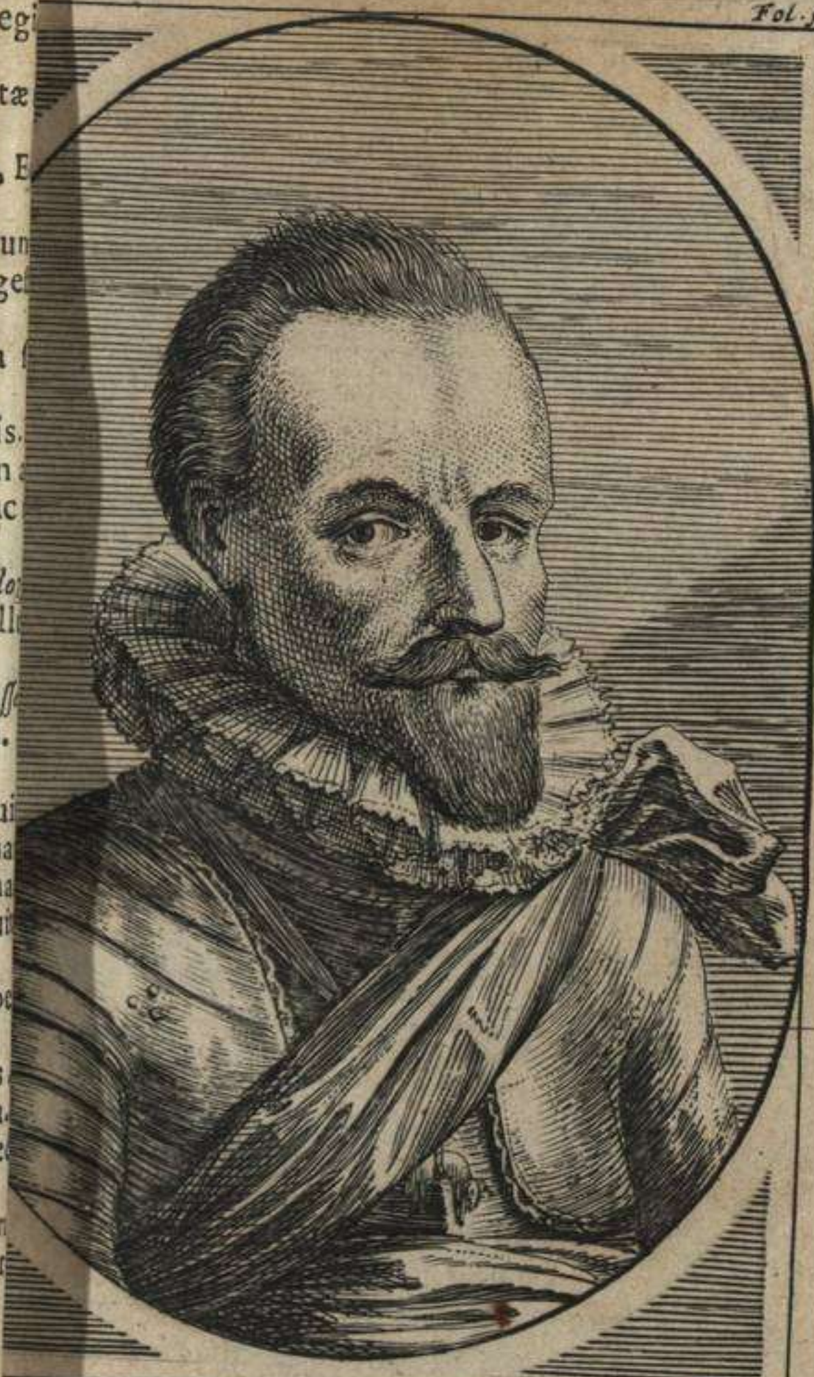
ALEXANDER FARNESIVS, Dux Parmæ et Placentiæ, Caroli V. nepos, Belgii Gubernator.

Legi inata ria, E mun onge erfa raris. u in or ac allo vall go aff aris. Equi ma rma equi ii be itus ariæ nspe s. es an castr