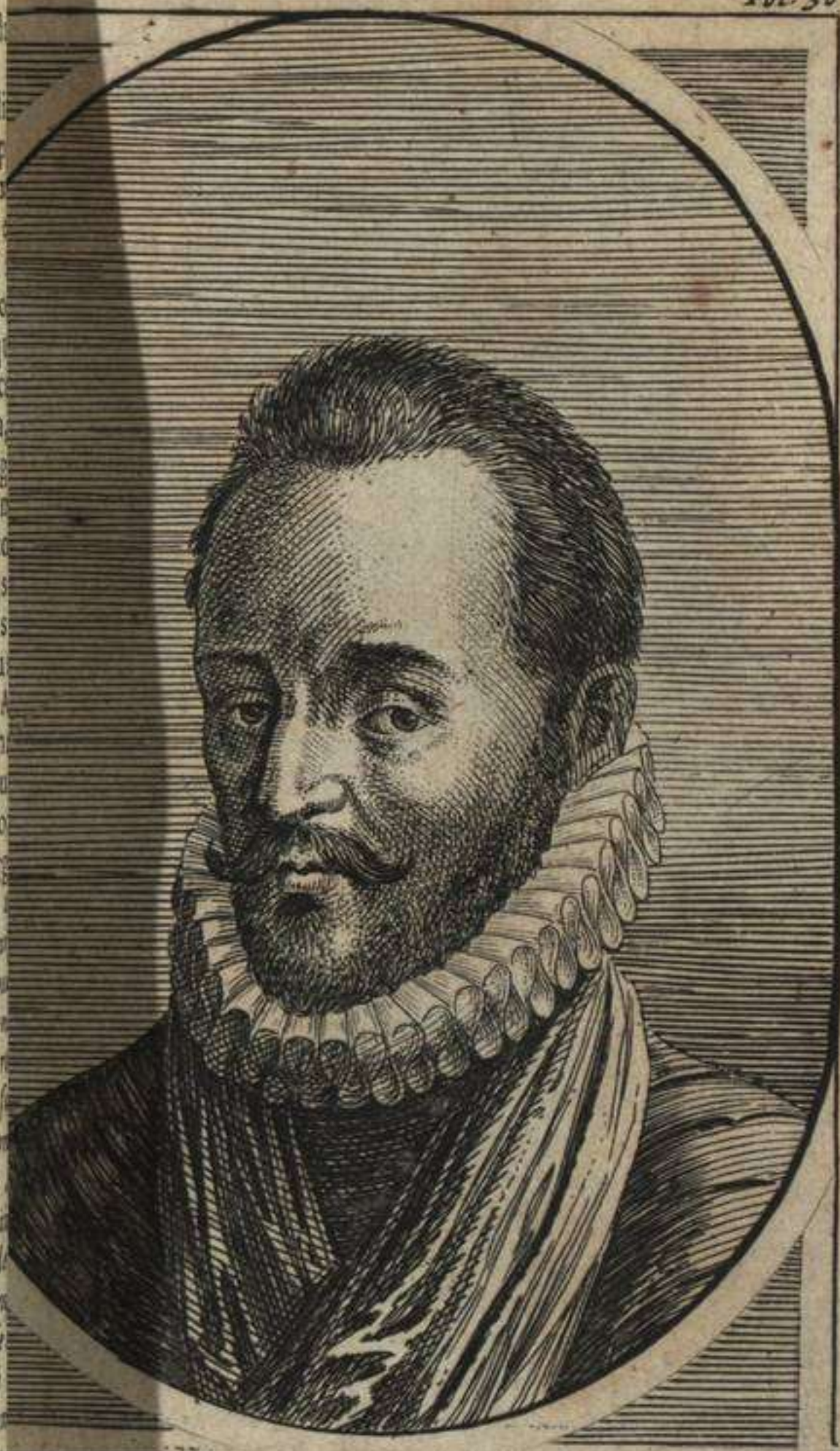
FRANCISCVS LANOVIVS, praefectus militiae ordinum Inse: rioris Germaniae.