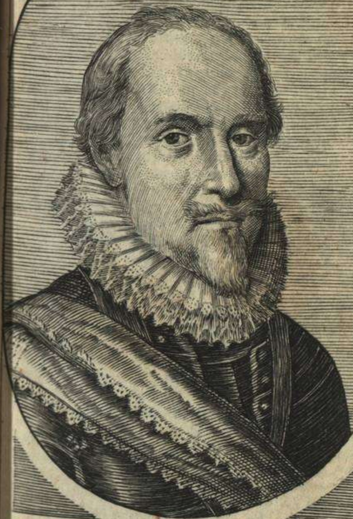
MAVRITIVS NASSAVIVS, Orangii Princeps, Comes Nassaviae etc. Foederatar. Provinciar. Gubernator.