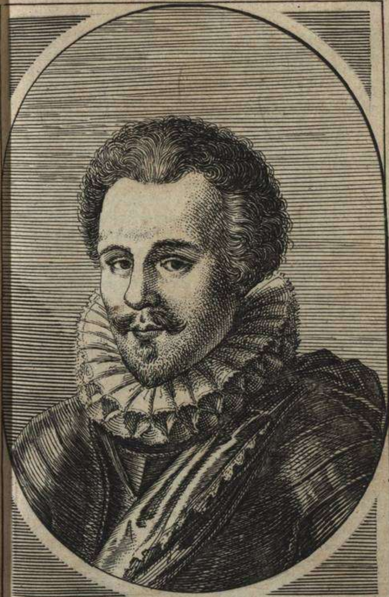
FRANCISCVS HERCVLES VALESIVS, Dux Andeg. Alençon. et Brabant. etc. Defensor Belgarum.