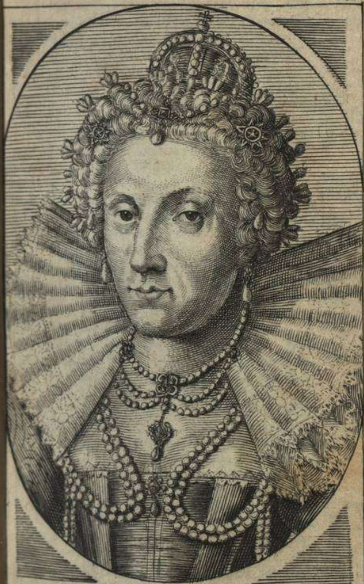
ELISABETHA, D. G. Anglicæ, Franciæ. et Hiberniæ, Regina.