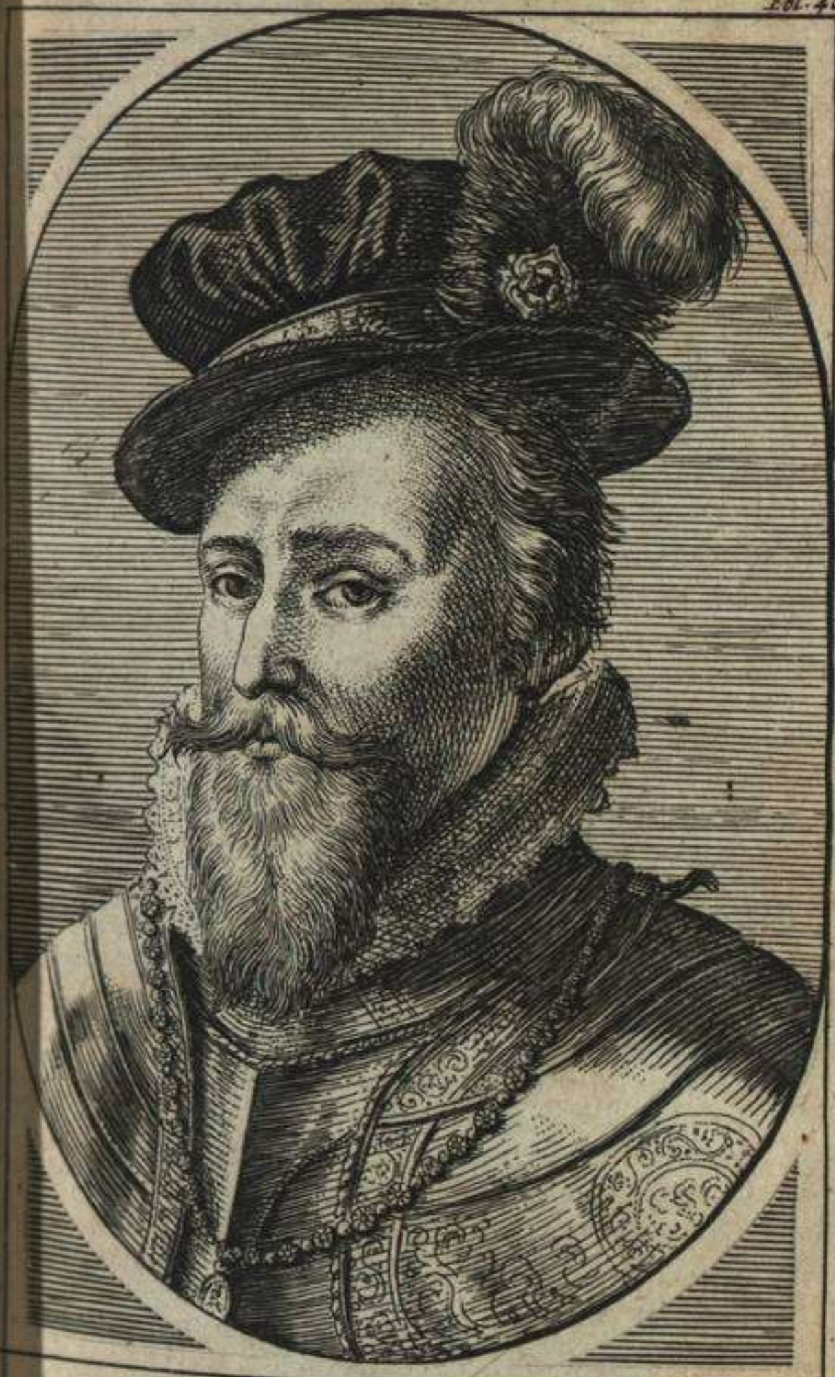
ROBERTVS DUDLEVS, Comes Leicestria, Baro Denbig. Gu- bernator Belgarum.