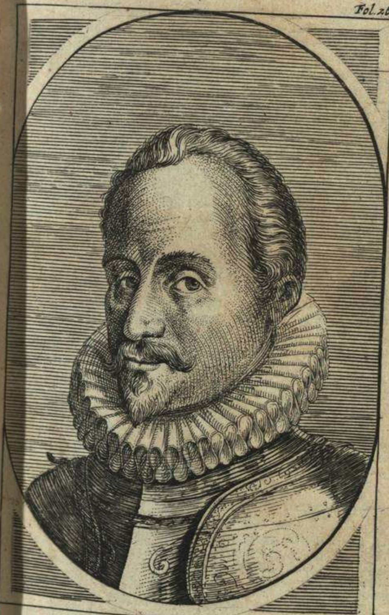
ADOLPHVS, Comes Meursia, Niernaer, Alpen, etc. Praefectus Gelriae et Ultrajecti.