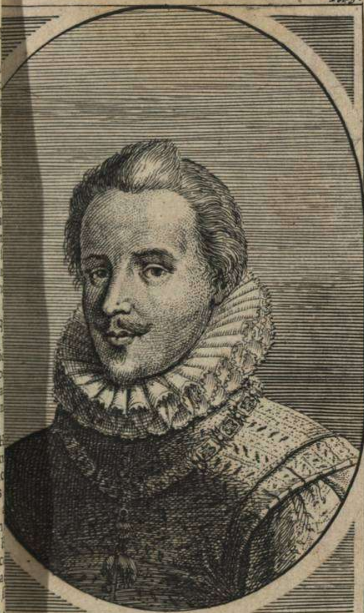
MATTHIAS ARCHIDUX AUSTRIÆ, Dux Burgundie, Comes Flandris, Foederati Belgii Gubernator.