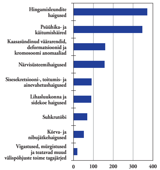
Joonis 3. Esimaskordne puue haiguste kaupa alla 16-aastaste vanuserühmas

Alla 16-aastaste seas on puue kõige sagedamini määratud hingamis- ja liikumishäirete haigustega lastele. Teisel kohal on psüühika- ja käitumishäired ning kolmandal ja neljandal kohal kaasasündinud väärarendid ning närvide haigused (vt joonis 3).