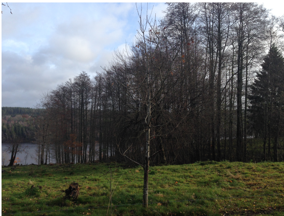
Figur 2. Bullaren.

tror de att det beror på att det är mer öppet och lättare att se dem helt enkelt. Det kommer även mer solljus ner till marken i och med avverkningen som gjorts. Kornas betande har sedan gjort det möjligt att hålla vegetationen nere (Gustavsson 2013) (Hellman 2013). Tommy har sett att landskapet efter restaureringen börjat likna hur det såg ut förr, alltså innan det växte igen. Han talade om att åtgärderna har gjort att det blivit som det var en gång i tiden då markerna betades och brukades av lantbrukarna i området. Det har han till exempel lagt märke till då han tittat på gamla bilder från bygden. De involverade har fått en stor förståelse för att djurens betande varit nödvändig för att hålla bort all sly som växer fram så snabbt. De som intervjuats är också överens om att djurens närvaro för med sig mycket glädje ”Kor är ju bra mycket trevligare än maskiner” (Hellman 2013).