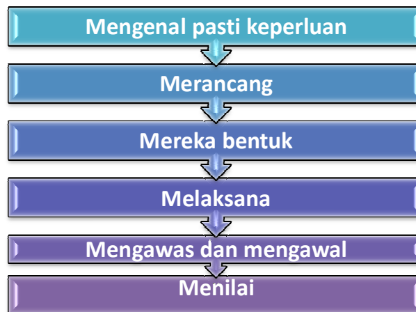
Rajah 2.3: Proses Pengurusan Fasiliti (Norman, 1991)

Seterusnya, Atkin (2003), berhujah pengurusan fasiliti juga dikenali sebagai kegiatan yang mempunyai sifat menyokong aktiviti teras sesebuah organisasi. Keberkesanan pengurusan fasiliti dapat dilihat daripada keupayaan untuk mencipta dan melaksanakan amalan yang dapat mengurangkan risiko serta menambah nilai bagi aktiviti teras sesebuah organisasi.