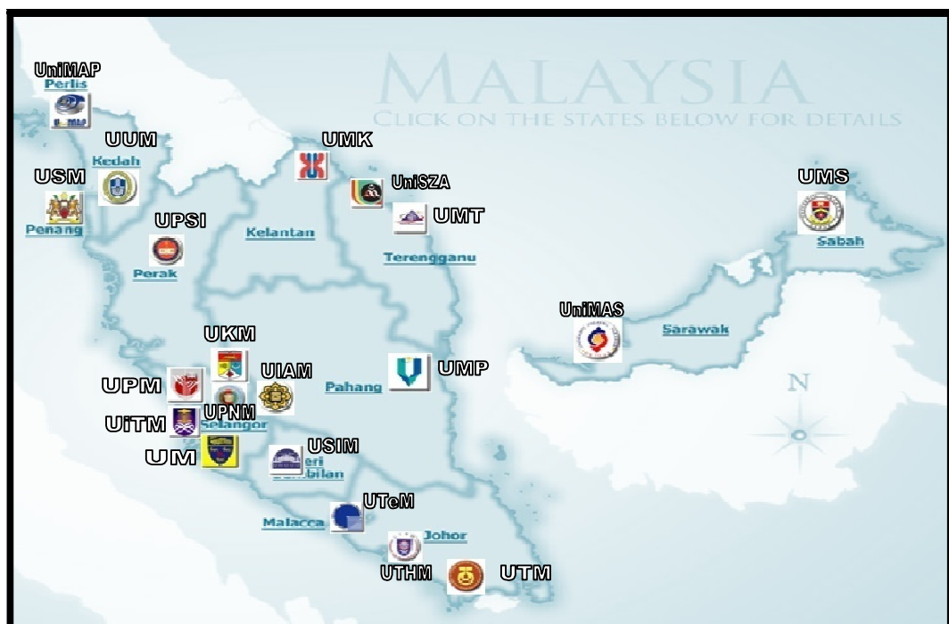
Rajah 2.4: Kedudukan IPTA di Malaysia (Adaptasi dari KPT, 2012)

Sistem pengajian tinggi dibentuk untuk memastikan bahawa IPT berupaya dalam usaha membina reputasi dengan keupayaan yang dinamik, berdaya saing selain mampu meramalkan cabaran masa hadapan dan bersedia untuk bertindak secara berkesan seiring dengan perkembangan global. Usaha meningkatkan keupayaan IPTA akan terus dilakukan untuk melaksanakan fungsi dan tanggungjawabnya dengan lebih cekap, telus dan berkesan ke arah mewujudkan sistem pengajian tinggi yang cemerlang. Di Malaysia, terdapat 20 Institusi Pengajian Tinggi Awam (IPTA) di bawah kawalan Kementerian Pengajian Tinggi Malaysia (2012). Rajah 2.4 menunjukkan kedudukan IPTA di Malaysia secara geografi.