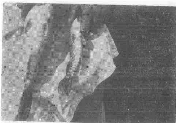
Slika 2. Analni otvori štuca

uslijed sporijeg rasta. U usporedbi sa ženkom mnogo su vitkiji i često tanjeg pigmentiranog trbuha, lagano mramoriranog. Na lagani pritisak rijetko kada pušta mlječ. Spolni otvor je od analnog otvora odijeljen uskom pregradom i normalne je boje.