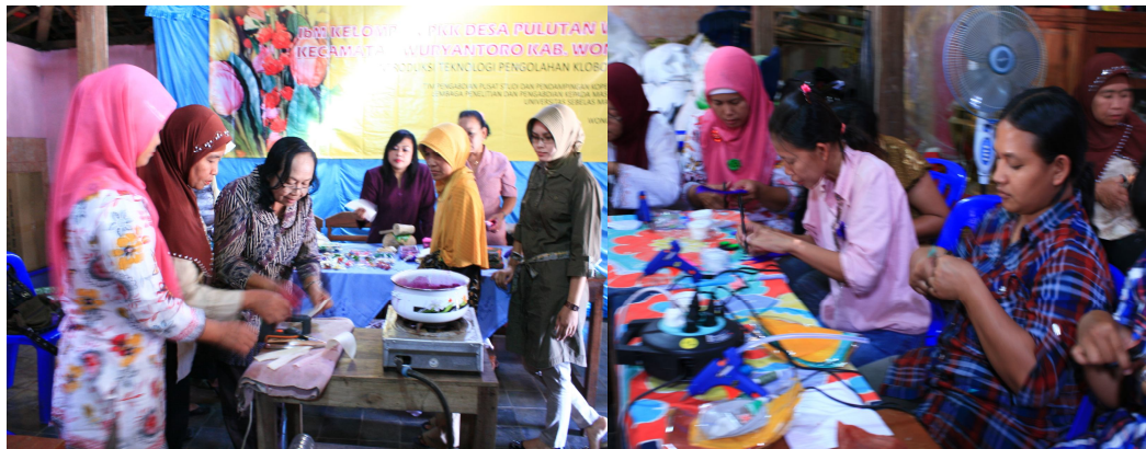
Gambar 2. Pelatihan Produksi Suvenir Klobot Jagung

Berikut gambaran pelaksanaan kegiatan pelatihan produksi kerajinan klobot jagung.