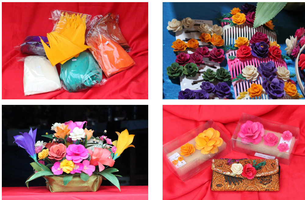
Gambar 3. Produk karya kelompok mitra

Berikut gambaran produksi kerajinan klobot jagung yang dihasilkan kelompok mitra.