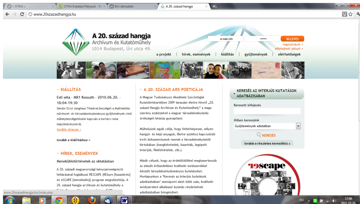
1. ábra: A projekt honlapjának nyitóoldala

is. A survey és a megnyitott web-oldal sikeres első lépésnek tekinthető a kvalitatív módszerekkel (és elsősorban interjúkkal) dolgozó szociológus szakma információáramlásának és kutatói kooperációjának megszervezéséhez. Az oldalt folyamatosan fejlesztettük a kutatás idején és annak lezárulta után is.