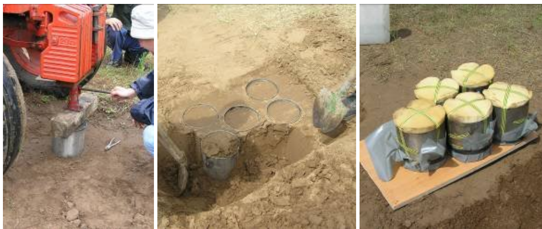
3. ábra: A mintavételezés főbb lépései.

Mintavétel: A nagypatronokat (rozsdamentes acéllemezből hajlítva, falvastagság: 2 mm, magasság és átmérő: 20 cm) a talajba nyomás előtt, belülről szilikon zsírral, vékony rétegben kikenjük. A patronok talajba nyomásához kapható Eijkelkamp gyártmányú 'híd', amelynek azonban két hátránya van: 1) nagyon drága, 2) a hidat a talajba rögzítő menetes száruk nagyobb talajellenállás esetén (pl. száraz talaj) kiszakadnak a talajból. A híd jól kiváltható a mintavétel helyének megközelítéséhez használt járművel (pl. terepjáró). Ennek segítségével a patronokat hidraulikus emelővel préseljük a talajba úgy, hogy a 20 cm magas hengerek 19 cm magasságig teljenek meg talajjal (3. ábra). A hengereket ezután körbeássuk és ásóval alájuk nyúlva óvatosan kifordítjuk őket a talajból. A hengerek alsó peremén túlnyúló talajdarabot hosszúpengéjű késsel vagy fűrészlappal lefaragjuk és a henger aljára, vastag gumival erős fólia darabot helyezünk. A henger tetejét szivacskoronggal zárjuk le.