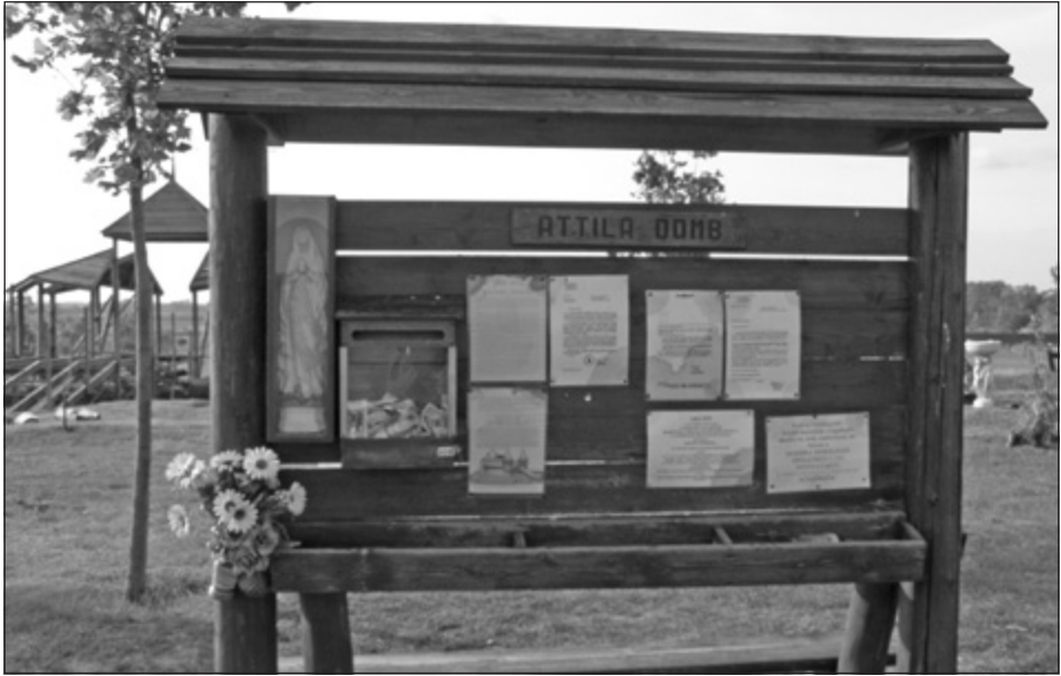
5. kép: Szűz Mária szobor az Attila-dombon