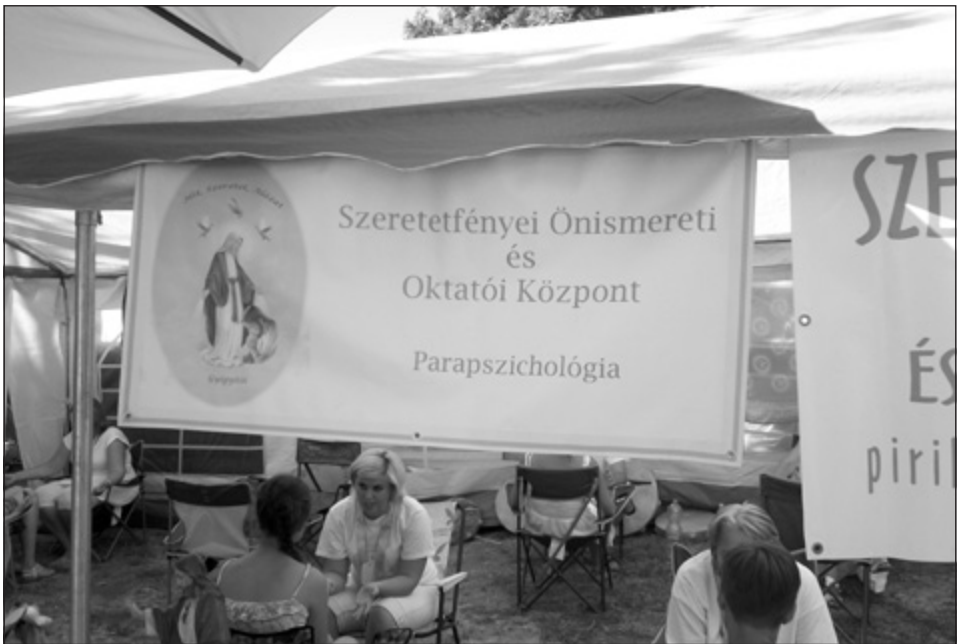
11. kép: Szűz Mária és parapszichológia. Gyógyító Falu a MOGY-on (2013)