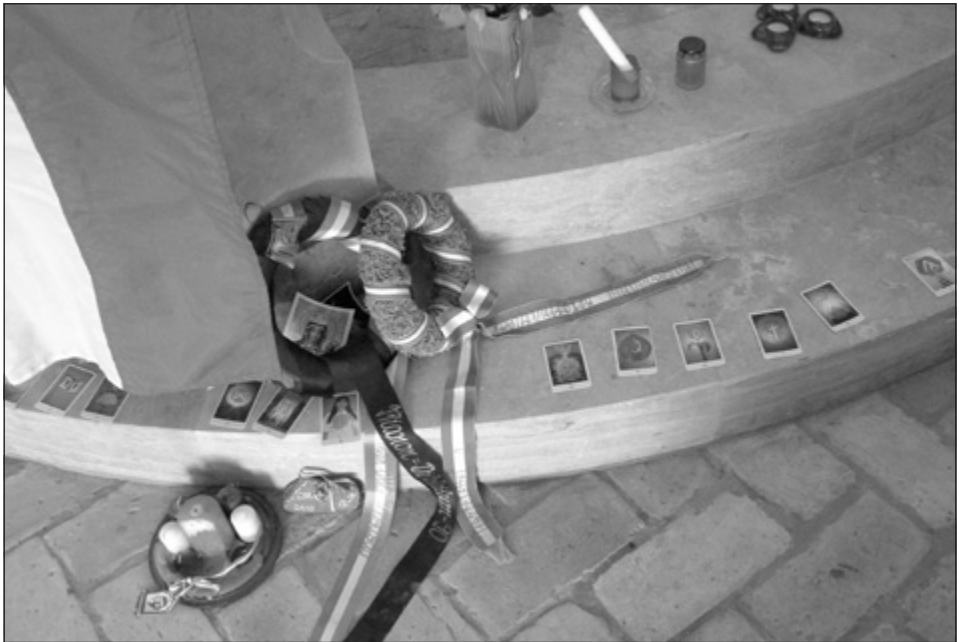
4. kép: Oltár - Verőce, Kárpát Haza Temploma