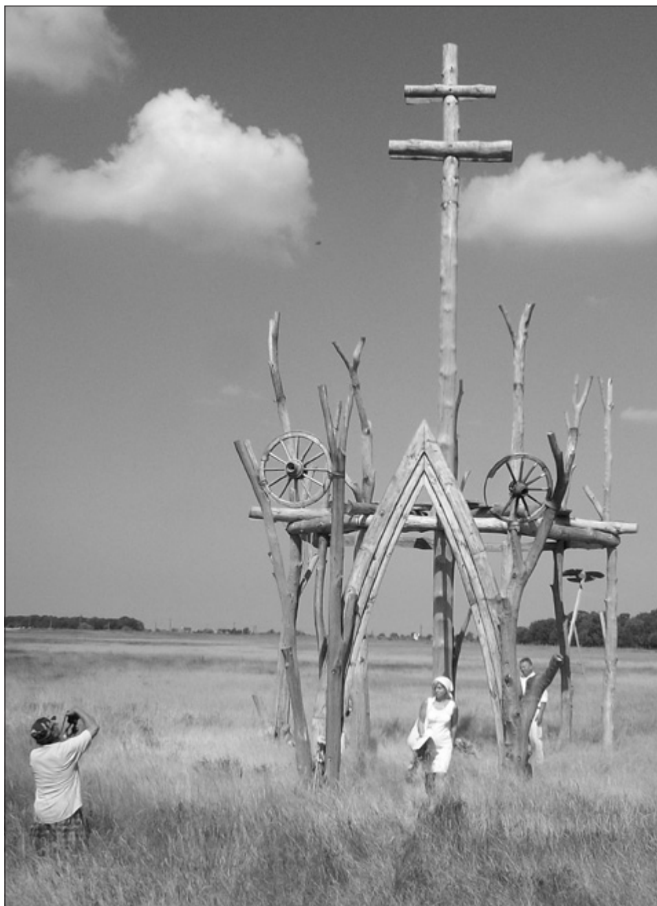
7. kép: Boldogasszony Ünnep a Hétboldogasszony Hajléka Kápolna maradványainál, Bösztörpuszta (2013)