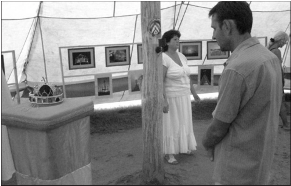
6. kép: Tisztelgés a Szent Korona másolata előtt a Hétboldogasszony Hajléka sátorban, Bösztörpuszta (2010)