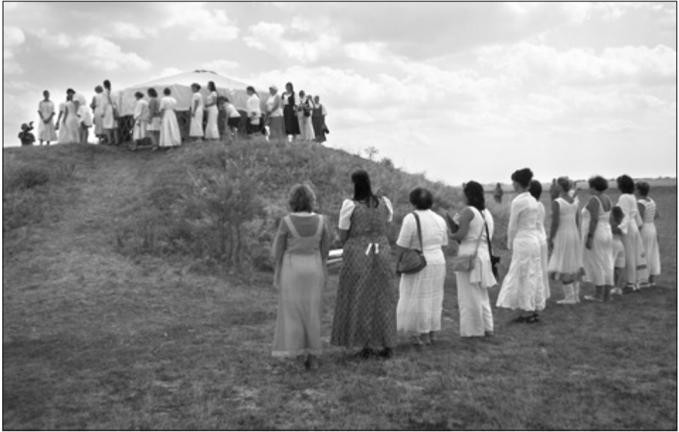
10. kép: Boldogasszony Ünnep, Apajpuszta (2013)