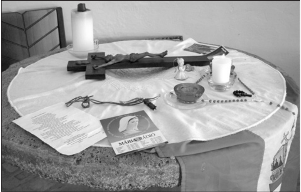
3. kép: Oltár - Verőce, Kárpát Haza Temploma