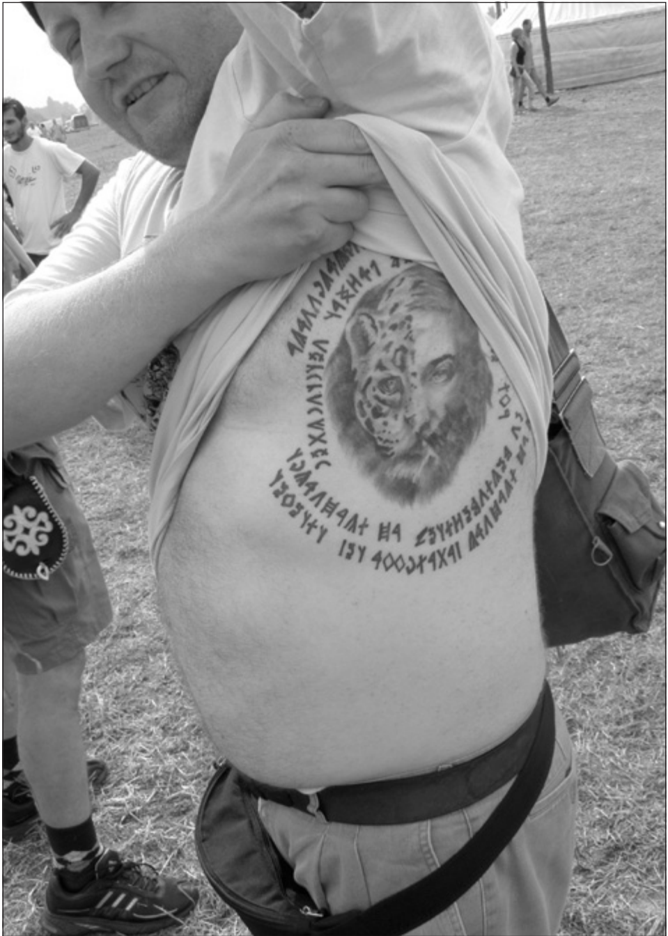
12. kép: Jézus a párduc rabbi. Kurultaj (2010)