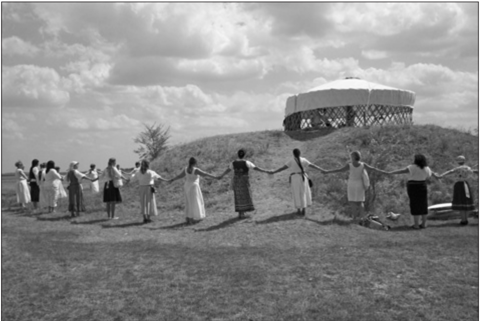
9. kép: Boldogasszony Ünnep, Apajpuszta (2013)