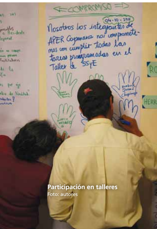
Participación en talleres