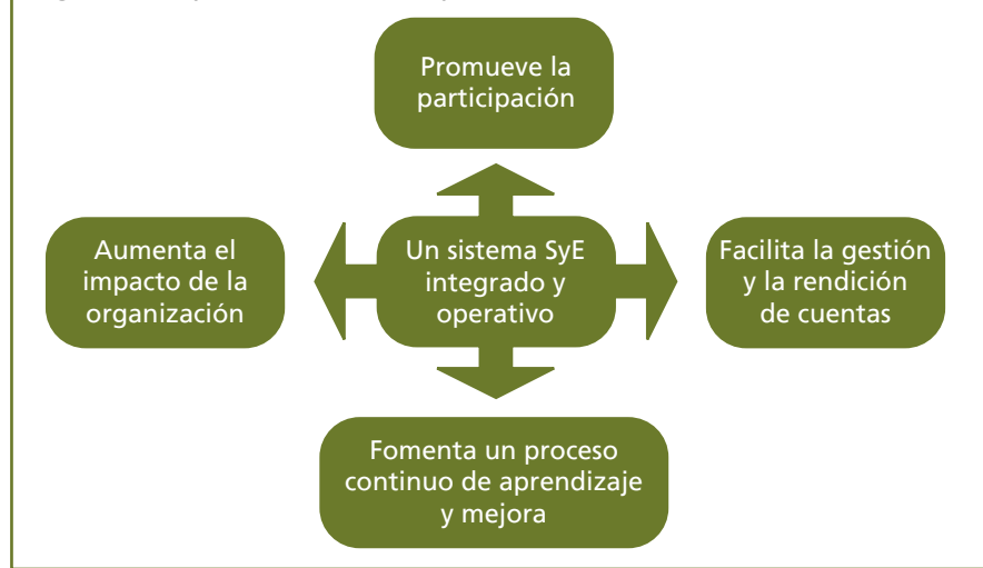
Figura 1: Objetivos del sistema SyE- ANPE PERÚ

Para ello, la implementación de un sistema de SyE en las bases de ANPE PERÚ, como herramienta básica de fortalecimiento organizacional, ha venido construyéndose en torno a cuatro objetivos fundamentales para nuestras organizaciones socias y las familias de productores ecológicos a todo nivel (local, provincial, regional y nacional). A su vez, estos objetivos constituyen las acciones indispensables del por qué del sistema (figura 1):