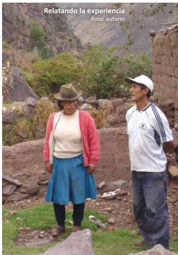
Relatando la experiencia