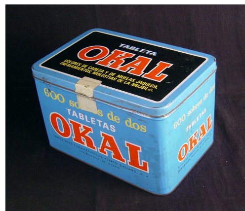
Un dels més grans de la col·lecció (14 x 22,5 x 15 cm)

D'una banda, atesa la seva mida, els envasos grans , que s'empraven habitualment per al condicionament de productes a l'engròs i la seva posterior venda a la menuda. Són els que contenen principis actius i/o preparats galènics, que es venien a doll, sobretot per a les presentacions en monodosi. Aquests envasos, un cop buits, s'aprofitaven per a conservar-hi altres productes, cosa que també succeïa en l'àmbit domèstic, i es continua fent amb les capses més petites, en les que, sovint, encara s'hi troben els objectes més inversemblants (medalles, monedes, botonets, agulles, primeres dents, etc.).