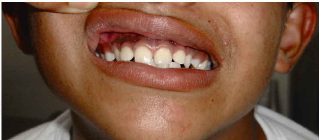
Figura 1. Se observa la hiperpigmentación en encías y acné en área peribucal

sistólico grado III/V audible en foco aórtico y abdomen blando con Bloomberg negativo. En genitales presenta vello púbico Tanner 4, pene de 11 cm x 1,5 cm y volumen testicular de 3 mL (Figura 2).