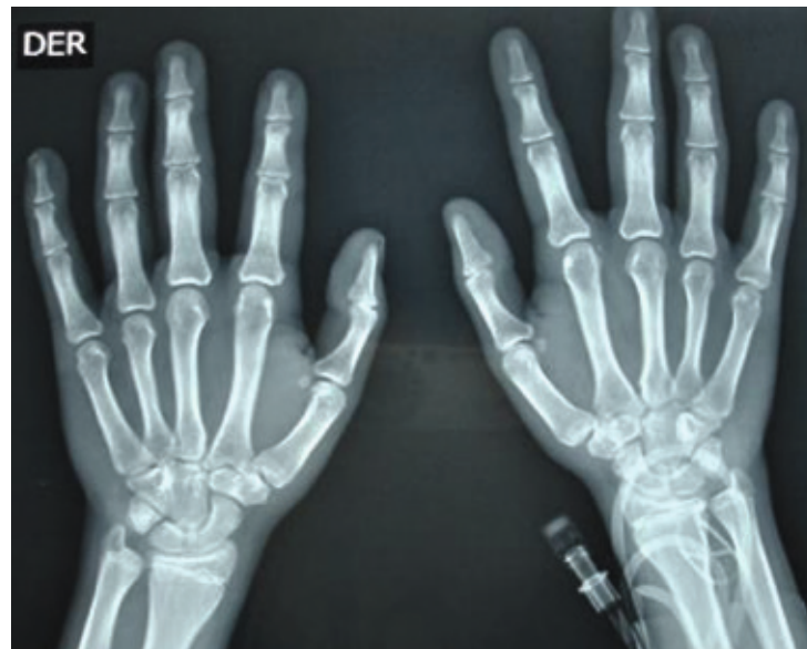
Figura 4. Se observa una edad ósea avanzada por el método de Greulich y Pyle correspondiente a 17 años