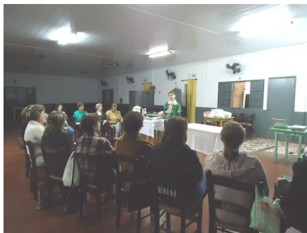
Figura 1. Apresentação do Programa de Extensão Universitária Plantas Medicinais às participantes dos clubes de mães do município de Palotina-PR.