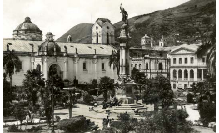
11. Monumento a la independencia. Sin autor. Quito. Fuente: Archivo histórico del Banco Central, hoy Ministerio de Cultura.

de la ciudad, está situada frente a la catedral y los principales edificios públicos del país. El diseño del monumento, el parque que lo rodea y la colocación de rejas con 8 puertas, fuentes, bancas y luminarias pusieron en evidencia el cambio de imagen que requería Quito, como capital de la República del Ecuador, que se disponía a celebrar el centenario de su independencia (Ver Figura 11).