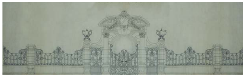
4. Dibujo de las rejas para el parque Juan Montalvo en Ambato. Plumilla, tinta sobre papel de hilo. Dimensiones: 0,515 x 1,86 m.

algún modo que las obras continúen sin dificultad, el apoyo de un agente que conocía el medio local y tenía contacto cercano con los miembros de la Junta era estratégico.