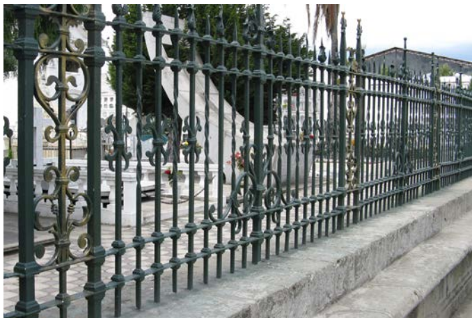
9. Rejas del parque Pedro Vicente Maldonado en cementerio de Riobamba.