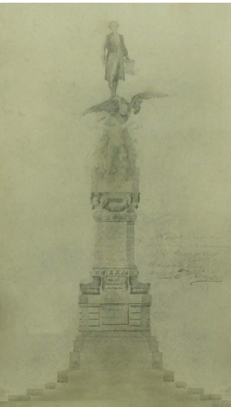
7. Proyecto del monumento a Pedro Vicente Maldonado. Riobamba. Papel fotográfico. Dimensiones: 20,2 x 12,5 cm.

en 1908. La ordenanza para el diseño y construcción del monumento tuvo lugar en 1909.