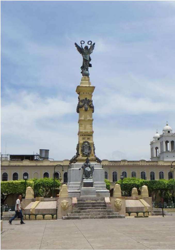
2. Monumento a la libertad en la plaza mayor de San Salvador. 1811. Monumento en mármol y bronce. Altura: 20 m