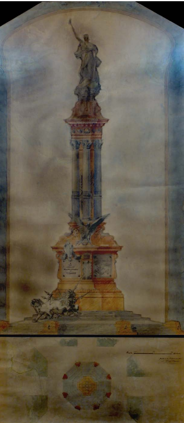
10. Acuarela del monumento a la Independencia de Quito. L. Durini. Acuarela sobre cartulina. Dimensiones: 0,65 x 1,31 m.

de la ciudad, está situada frente a la catedral y los principales edificios públicos del país. El diseño del monumento, el parque que lo rodea y la colocación de rejas con 8 puertas, fuentes, bancas y luminarias pusieron en evidencia el cambio de imagen que requería Quito, como capital de la República del Ecuador, que se disponía a celebrar el centenario de su independencia (Ver Figura 11).