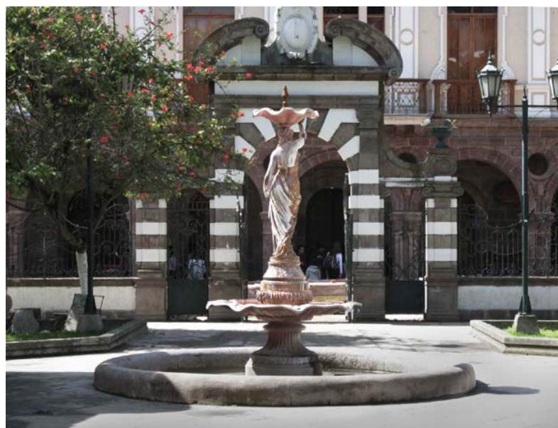
6. Fuente y cerramiento del parque de Ambato.

sin embargo, en la práctica las fuentes fueron elaboradas por la fábrica Fonderies d'art du Val d'Osne, cuya dirección en París era 58 Bd. Voltaire (trabajo de campo).