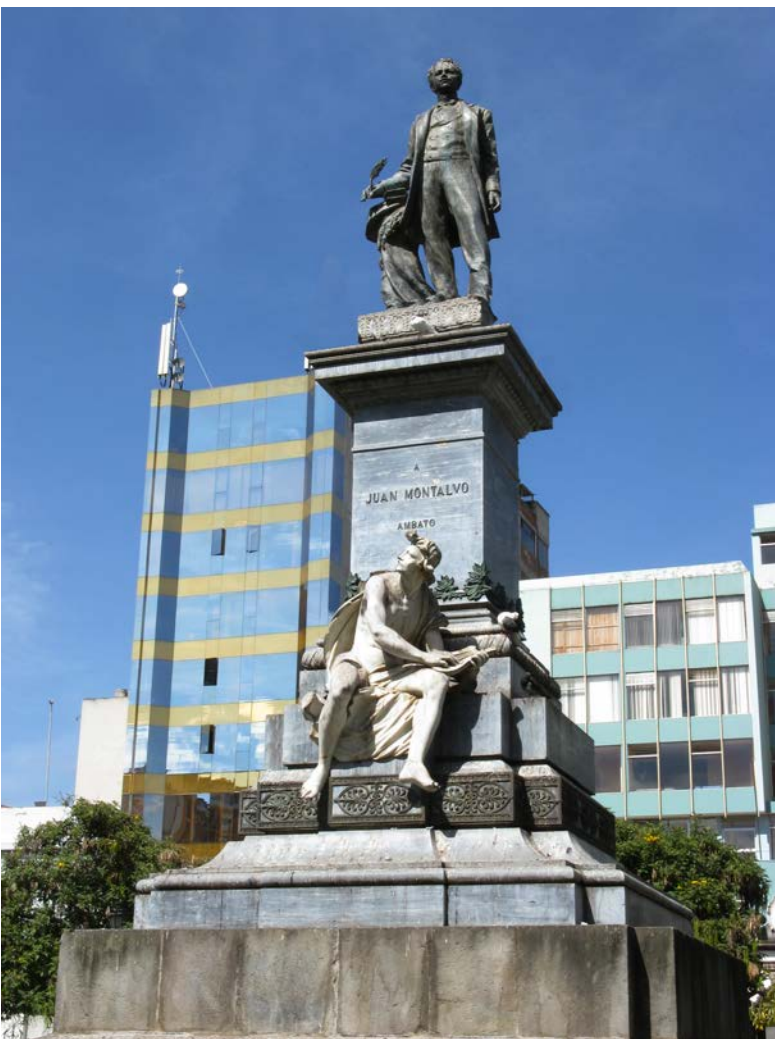
5. Monumento a Juan Montalvo. Ambato.

su preocupación por la ejecución de las piezas del monumento, tiempos, costos, y la entrega oportuna del boceto escultórico para la toma de decisiones por parte de la Junta: