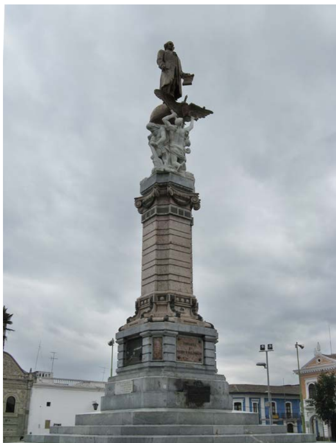
8. Monumento a Pedro Vicente Maldonado. Riobamba.

cargadas. Esto originó un juicio por parte del Municipio de Riobamba en contra de Francisco Durini, quien con sus abogados intentó evitar la multa y la cárcel, para lo cual solicitó una prórroga del plazo del contrato. Un fragmento de la defensa está suscrita por Juan Antonio Vela y recogida del archivo municipal por Franklin Cepeda: