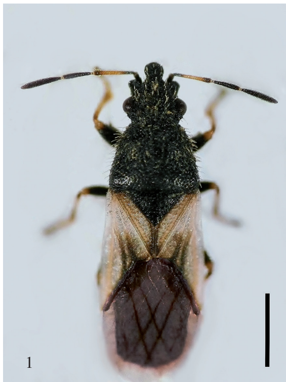
Figura 1. Metopoplax ditomoides , ejemplar adulto. Escala: 1 mm.