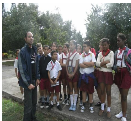
Figura 2 a: Visita guiada con niños de la escuela primaria “René Fraga Moreno”.

En los años 2012 al 2014, se realizaron el mayor número de visitas con los estudiantes de nivel primario, teniéndose como promedio 16 niños por cada visita programada para la escuela (Figura 2 a y b).