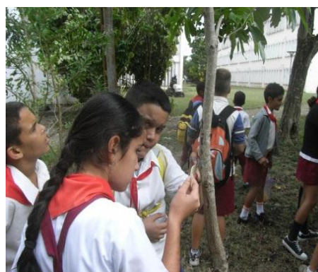
Figura 2 b: Observación de las características de órganos de las plantas del bosque martiano.