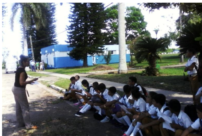
Figura 3: Estudiantes de la escuela secundaria “Cándido González”, en visita al Jardín Botánico de Matanzas.

Las escuelas secundarias incorporadas a las visitas guiadas fueron: “Antonio Berdayes”, “Héroes del Moncada”, “Protesta de Baraguá”, “Cándido González”, Escuela de Arte “Alfonso Pérez Isaac”, todas del Municipio Matanzas. (Figura 3).