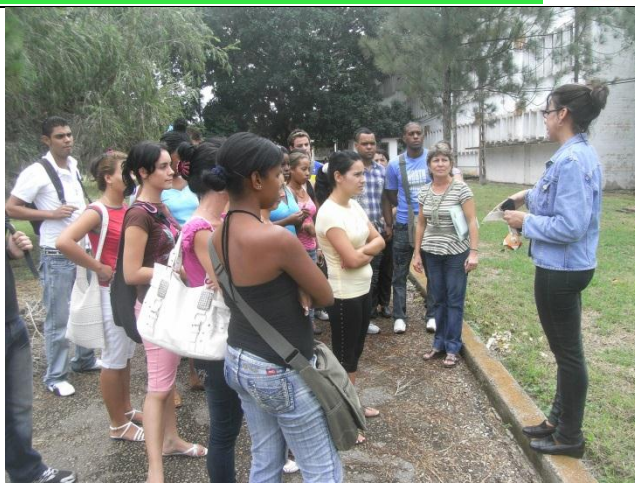
Figura 4: Estudantes universitários de la Carrera Ingeniería Química en visita guiada en el Jardín Botánico de Matanzas.

El resultado acerca de las visitas guiadas que se contabilizó en 688 estudiantes de primaria, 303 de secundaria básica y 600 universitarios, en los diferentes cursos ha sido un logro del jardín botánico de Matanzas, a partir de que la atención a las visitas era la responsabilidad de estudiantes del grupo científico del jardín. En los últimos años se elevaron las visitas en un 50 % con la presencia de un especialista en educación ambiental potenciándose la atención hacia los estudiantes universitarios. (Figura 5).