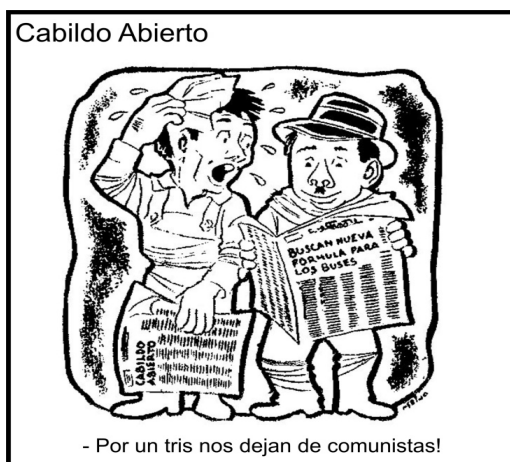
La Calle (Bogotá) marzo 6 de 1959, pág.6.