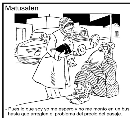
La Republica (Bogotá) marzo 15 de 1959, pág. 4.