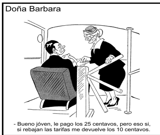
La Republica (Bogotá) enero 26 de 1959, 4