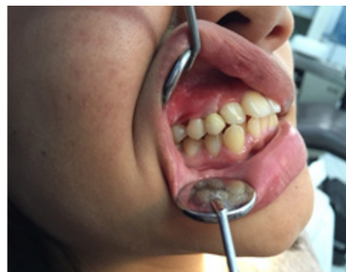
Gambar 6. Insersi Mahkota #13